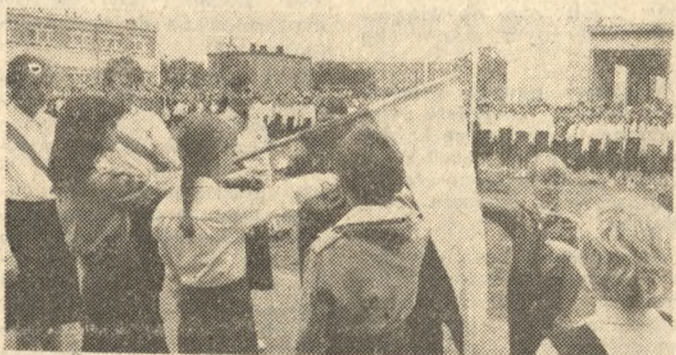
Poznańska młodzież ślubuje godnie spełniać swoje uczniowskie powinności.

Wznowila także regularną prace komunikacja miejska Wrocławia: na trasy wyjechały wszystkie autobusy i tramwaje. Pracują wszystkie zakłady przemysłowe miasta, m. in. Fabryka Wagonów „Pafawag”, centrum „Mera-Elwro”, „Dolme”, „Predom-Polar”, Wrocławskie Fabryki Mebli. (PAP)