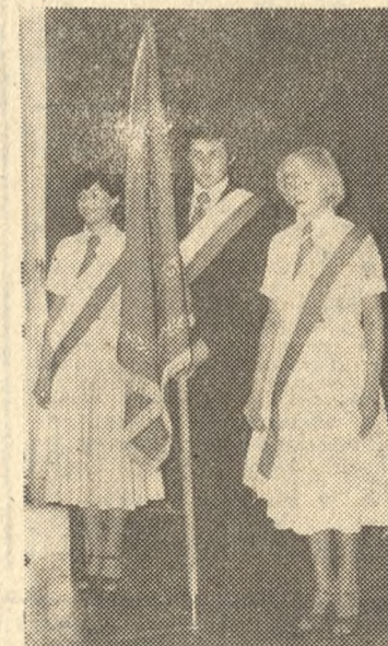
Poczet ze sztandarem, zdobytym przez Spółdzielnię Mieszkaniową „Osiedle Młodych” w Poznaniu.

Zdaniem tego naukowca, za chodniemiemy socjaldemokraci z H. Schmidem na czele mogą obecnie liczyć na 48 procent wszystkich głosów wyborczych, zaś wolni demokraci H. D. Genschera na zdobycie dalszych 7 procent. (PAP)