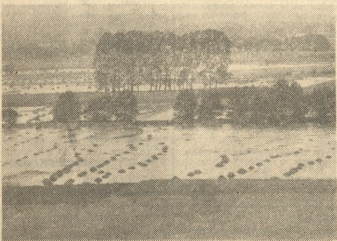
Woda zalała łąki w Dolinie Konińsko-Pyzderskiej. Na str. 3 zamieszczamy artykuł pt. „Wielka woda mogła być mniejsza”.