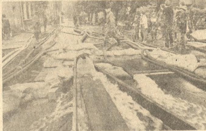
W dwa dni strażackie pompy zużyły w Strzałkowie 12 ton benzyny, ale woda opadła prawie o metr.

Ponad 25 procent tych dwóch upraw jest pod wodą. Część z nich nie da plonu. Rolnicy wiedzą to najlepiej, toteż już w pierwszych dniach lipca spadły ceny na krowy i prosiaki.