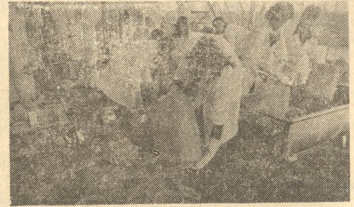
Na zdjęciu: junacy przy myciu pojemników.

Dziewczeta i chłopcy z Ochotniczych Hufców Pracy wykonują różne polecenia dyrekcji Hortexu w Środzie (Poznańskie). Gdy nie ma owoców do przetwarzania, junacy kopia rowy i zbijają skrzynie, a junaczki segregują makulaturę, sprzątają pomieszczenia. Tylko hufiec, pracujący w kuchni, za wesele robi to samo. Wiadomo, gotować trzeba niezależnie od tego, czy porzeczka lub groszek trafią na nowoczesne linie przetwórstwa owocowego. Kuchnia pracuje 20 godzin na dobę. Pierwsza zmiana rozpoczyna dzień o czwartej —