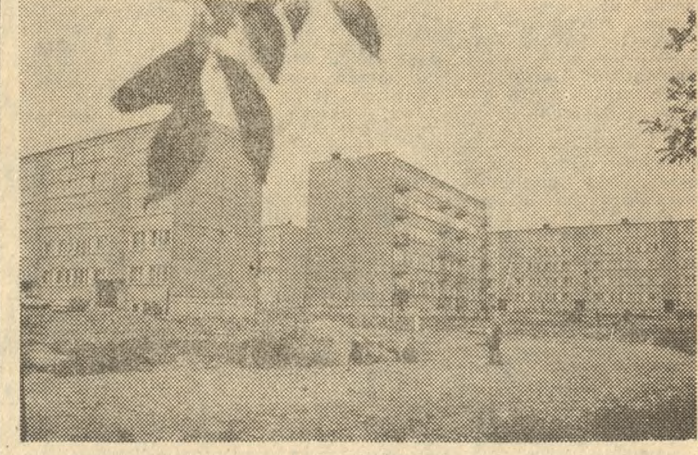
Fragment budowanego Osiedla Południe przy ul. Wrocławskiej.

Z czterech nowych osiedli mieszkaniowych w Jarocinie (Kaliskie) najmłodszym a zarazem największym jest — Południe, zlokalizowane przy ul. Wrocławskiej. Dotychczas stało tam siedem domów, a dwa dalsze lata dzień zostaną przekazane Spółdzielni Mieszkaniowej w Jarocinie. W budowie znajdują się trzy następne domy, z których jeden ma być gotowy w tym roku, a pozostałe w 1981 roku.