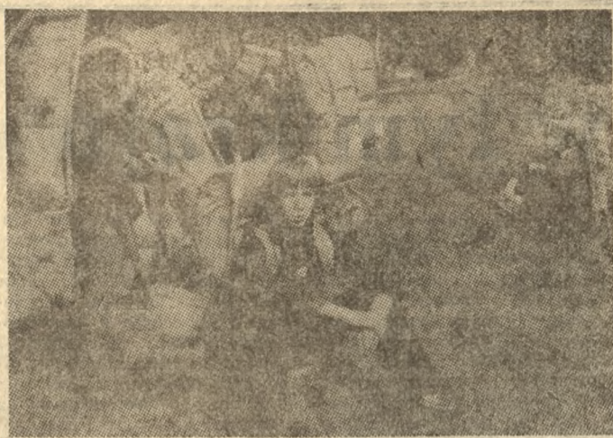
CAF — fot. Moroz