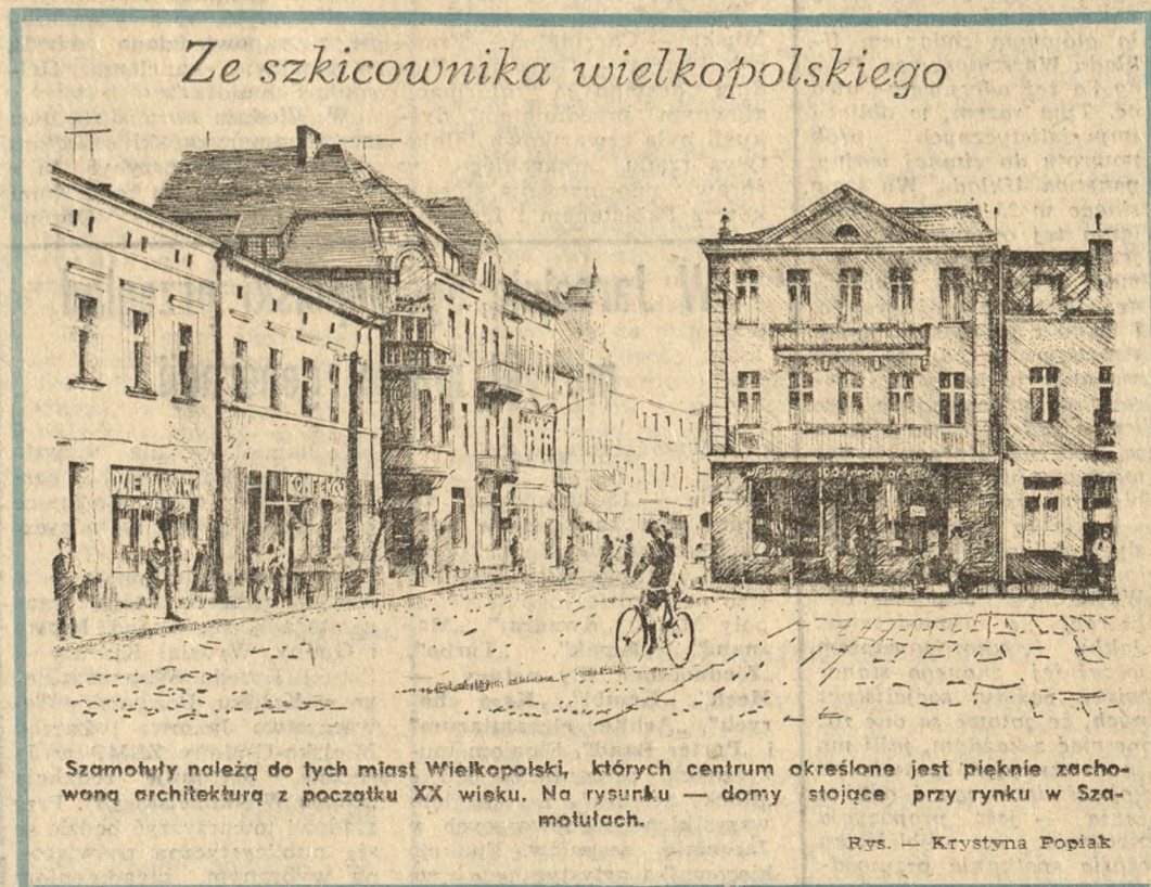
Ze szkicownika wielkopolskiego

Doniosły dokument z narady, która zakończyła się 15 bm. w Warszawie, zawiera konkretne, konstruktywne, realistyczne propozycje rozwiązań — w ducha umocnienia procesu odprężenia, poszanowania równouprawnienia, niepodległości i suwerenności na rodów, nieingerencji w sprawy wewnętrzne innych państw, zagwarantowanie wszystkim narodom praw do swobodnego i niezawisłego rozwoju oraz postępu. (PAP)