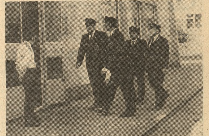
Kolejarze leszczyńskiego Węzła PKP przed lokalem wyborczym.

W województwie leszczyńskim w usprawnieniu procesu