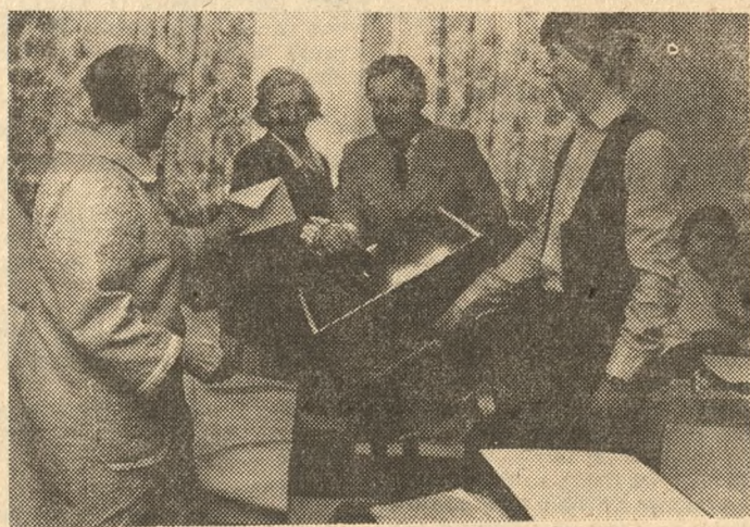
Podczas głosowania w kaliskim szpitalu.

300 członków dwóch ochotniczych hufców pracy wraz z opiekunami głosowało wspólnie w obwodach nr 1 i 8 we Wrzesznie. Wielu z nich oddało swoje głosy pierwszy raz w życiu. Gremialnie stawili się do urn wyborczych w Obwodzie nr 8 w Marzenie pracownicy PGR