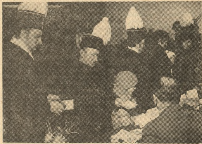
Konińscy górnicy głosowali w galowych strojach.

W lokalnej Komisji Obwodowej nr 32 w Kaliszu około godziny 8 rano głosy oddało 150 uczennic Zespołu Szkół Medycznych: Liceum Medycy-