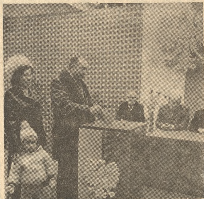
W lokalu Obwodowej Komisji Wyborczej w Zakładach Przemysłu Metalowego „H. Cegielski” w Poznaniu.