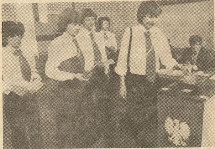
Głosują dziewczęta z Wielkopolskiej Fabryki Obuwia „Polania” w Gnieźnie.