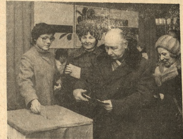
W lokalnym wyborczym w pilskim Domu Kultury Kolejarza.

W Wągrowcu, Czarnkowie i Chodzieży w historycznych mundurach głosowali powstańcy wielkopolscy, a do urn wyborczych w Wałczu, Jastrowiu, Okonku przybyli kombatanci drugiej wojny światowej, uczestnicy walk o przełamanie Wąhu Pomorskiego — pionierzy, którzy zagospodarowywali prastare piastowskie ziemie. (w)