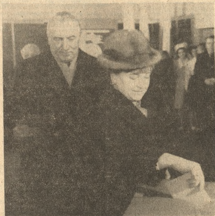
I sekretarz KC PZPR — Edward Gierke z małżonką Stanisławą, podczas głosowania.

W świątecznej szacie powitał Poznań dzień wyborów. Biało-czerwone flagi, plakaty i planse towarzyszyły mieszkańcom udającym się od wczesnych godzin rannych do lokali