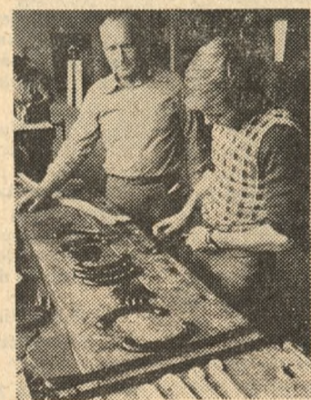
Diabeł zna się na ludziach, a mistrz na meblach. Więc lepiej słuchać mistrza.

się według starej receptury. Wykonane teraz i ozdobione okuciami czeka na tego, w którego domu urozmaici meblową przecieć domu urozmaici meblową przecieć. Chwytam za jedną z szuflad, a przy okazji chwytam miarstrza na fuszerce, bo szuflada się nie otwiera. Uśmiełliśmy się potem obaj, bo była to „ślepa” szuflada. Te prawdziwe były po drugiej stronie biurka. Ale „ślepe” też muszą być i to takie, żeby nikt nie poznał się na atrapie. Bo