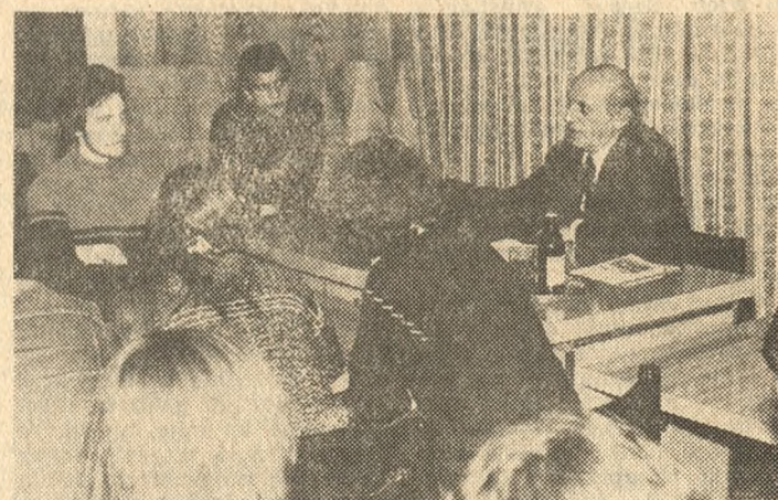
W poznańskiej Akademii Ekonomicznej — podczas spotkania z I sekretarzem Komitetu Uczelnianego PZPR.