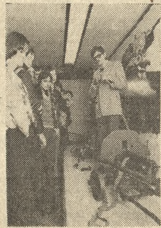
Sala broni w Muzeum Wyzwolenia Pily.