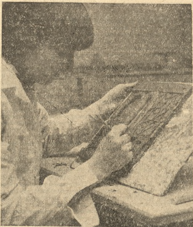
W Państwowym Liceum Sztuk Plastycznych im. Jana Cybisa w Opolu, działającym od 21 lat, kształcą się młodzież w dwóch kierunkach — wystawienniczym i form użytkowych. Do tej pory placówkę tę opuściło ponad 350 absolwentów. Duża ich część pracuje w szkołach, muzeach i placówkach kulturalno-oświatowych. Na zdjęciu: podczas zajęć w Państwowym Liceum Sztuk Plastycznych im. Jana Cybisa w Opolu.