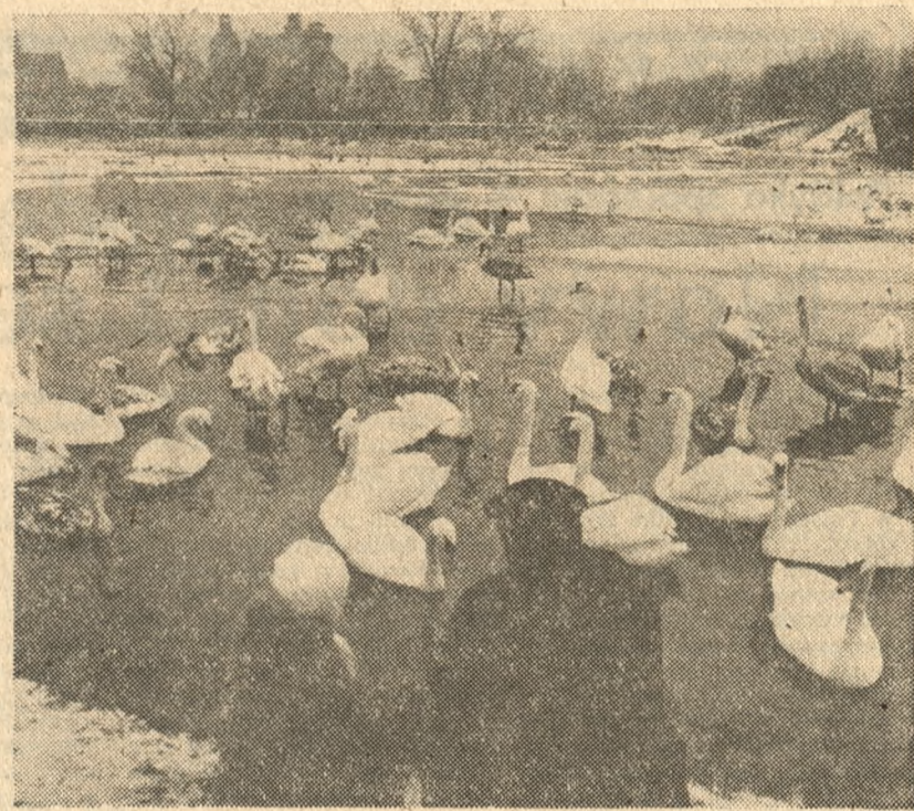
Na rozlewiskach Warły w okolicach Koła (Konińskie) zimuje stado łabędzi i kaczek. Dokarmiają je okoliczni mieszkańcy.