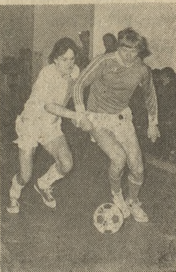
Fragment eliminacyjnego meczu Lech — Polonia zakończony niepodzielonym zwycięstwem Polonii 5:4.

Najciekawszym spotkaniem turnieju było spotkanie o pier-