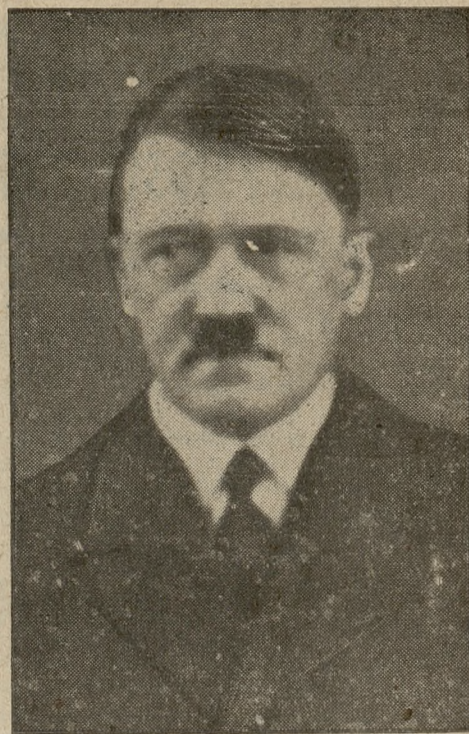
Adolf Hitler przywódca nar. socjalistów po drugim oczekiwaniu doszedł wreszcie do władzy, stając na czele rządu wojującego pangermanizmu.

W programie koncertu był poza tem „Anelli” Różyckiego, odegrany z nastrojem i starannością, oraz piąta symfonia Czajkowskiego, skrócona i przyspieszona. Ten zabieg nie zawadził, bo istotnie w tem pięknie i w wielkiej ska-