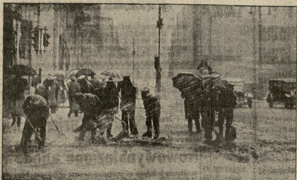
Zima w tym roku obfituje w rozmaite niespodzianki. Oto obrazek ze słonecznego Maridrytu, który dotąd neogół miał tylko słabe wyobrazenie o zimie.