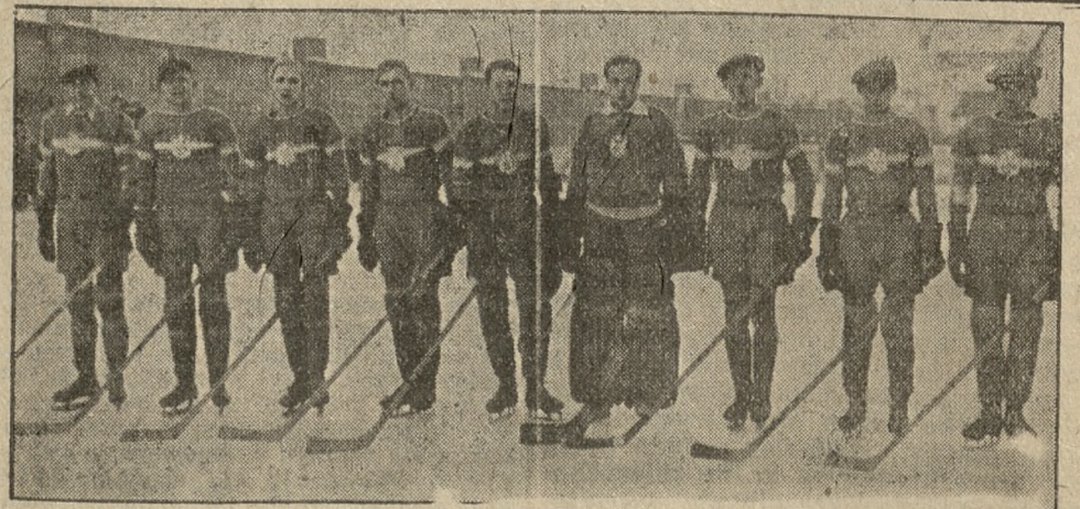
Drużyna Akademickiego Związku Sportowego, która po zdobyciu mistrzostwa okręgu walczyć będzie o mistrzostwo Polski.

— Łazarski Klub Szachistów organizuje seans gry równoczesnej na 20 szachownicach który rozegra w czwartek, 26