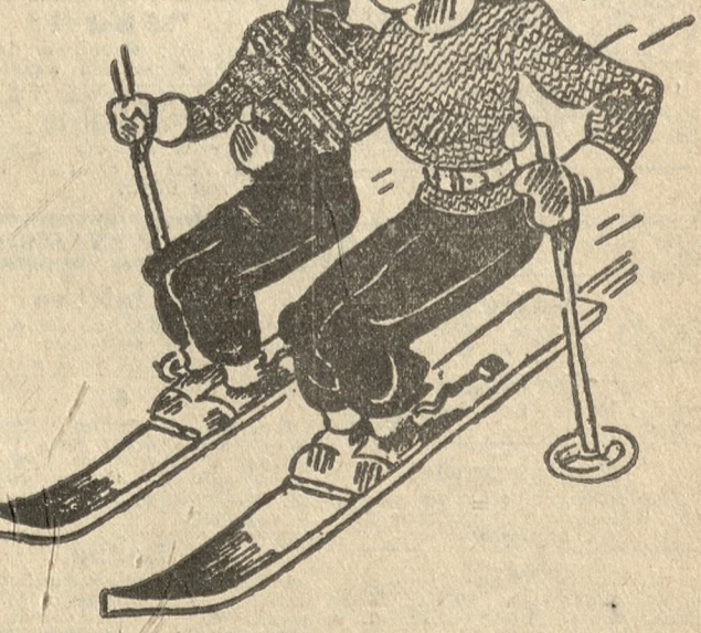
Sentymentalne narty: zmniejszają do połowy kosztą - podwajając przyjemność. (Der Goetz - Wiedeń). S. F.

Przedpłata na miesiąc luty 1933 r. za oba wydania razem w Poznaniu w ekspedycji zł 3.20, w agencjach w mieście zł 3.50, z odnośnieniem do domu w Poznaniu zł 3.70, z odnośnieniem przez pocztę poza Poznaniem miesięcznie zł 4.14, kwartalnie zł 12.40, pod opaską miesięcznie w Polsce zł 1.50, w innych krajach zł 2.50. W razie wypadków spowodowanych siłą wyższą, przeszkod w zakładzie, strajków i t. p. wydawnictwo nie odpowiada za dostarczenie piśma, a abonent nie ma prawa domagania się niedostarczonych numerów lub odszkodowania. W wydaniach wielkostronnych i uroczystościowych poprzedza normalną codzienną część numeru z reklamami i ogłoszeniami materiał poświęcony danej uroczystości. Telefony do Redakcji i Administracji: 4461, 1476, 3307, 3524, 3525, 4072, w niedziele, święta i nocą tylko 1476, 3524 i 4072, filja Stary Rynek 25-55. - P. K. O. Poznań nr. 200 149.