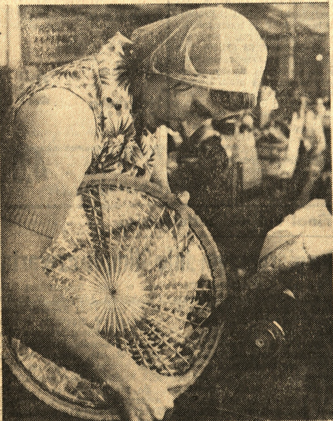
Huta Szkła Kryształowego „Violetta” w Stroniu Śląskim (województwo łódzkie) istnieje od ponad stu lat. Corocznie liczba szlifowanych w niej kryształów systematycznie wzrasta. W tym roku planuje się wytworzenie 2 600 ton atrakcyjnych wyrobów.

Na zdjęciu: jedna z pracownic szlifuje patere.