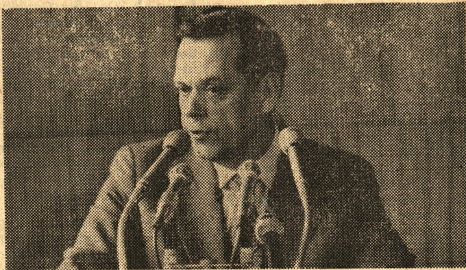
Premier J. Pińkowski.