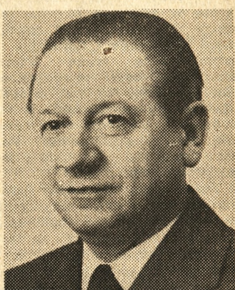
Edward Babiuch — prezes Rady Ministrów.

Przed 35 laty, w maju 1945 r., mnie — żołnierzowi I Armii WP, stojącemu na czele delegacji wyłonionej z jednostek wojskowych, walczących w Berlinie, przypadł zaszczyt