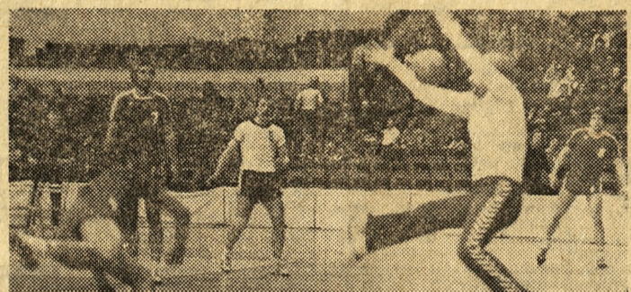
Na zdjęciu: jeden z nieskutecznych ataków Grunwaldu.