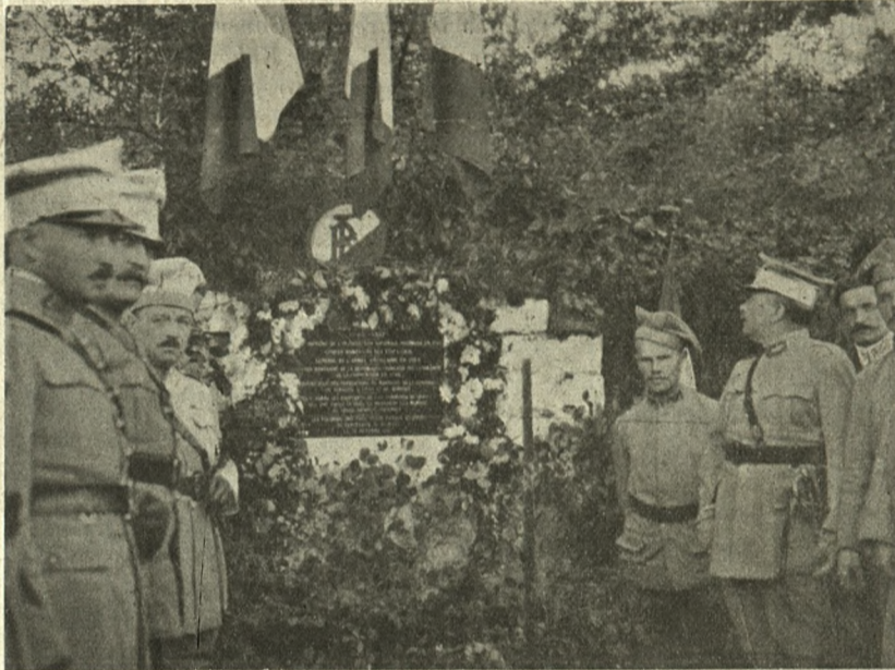
PLAQUE COMMÉMORATIVE FIXÉE SUR LES RUINES DE L'ANCIEN MONUMENT ÉRIGÉ A KOŚCIUSZKO EN 1836 PRÈS DE MONTIGNY.