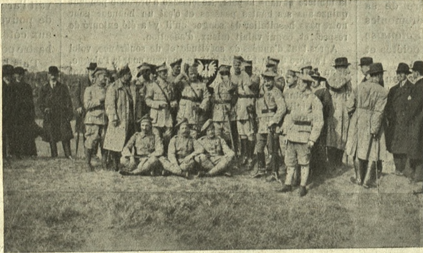
UN GROUPE D'OFFICIERS ET DE SOLDATS SUR LA COLLINE OÙ DANS UN AVENIR PROCHAIN UN MONUMENT SERA ÉRIGÉ A KOŚCIUSZKO