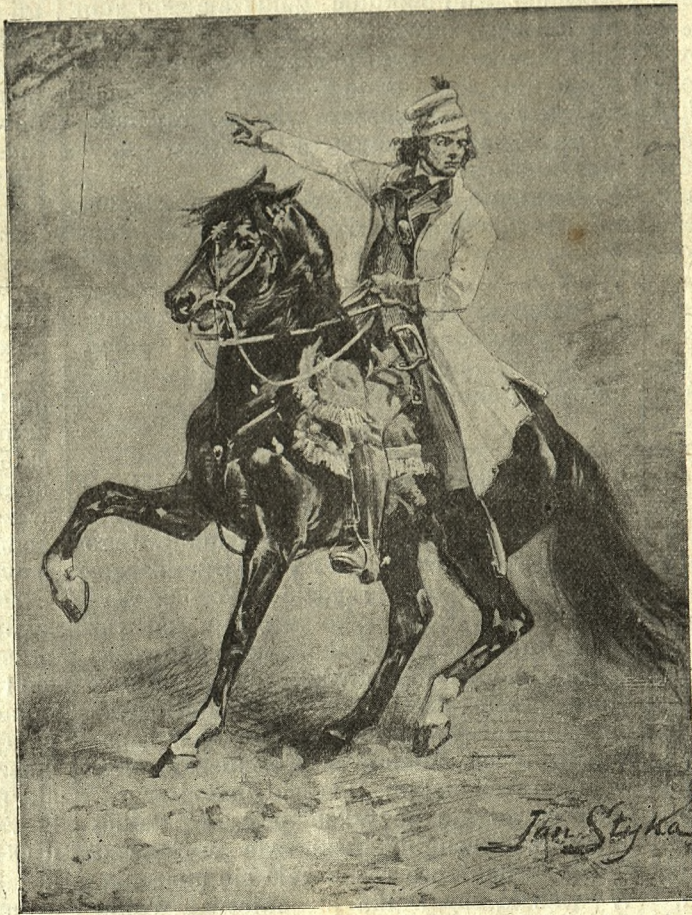
[Rysował Jan Styka.]

Wkrótce Kościuszko udał się do Ameryki Północnej w połowie 1776 roku, gdzie koloniści anglo-sascy podnieśli sztandar powstańczy przeciwko uciskowi angielskiemu. Przyjechał tu, bo wiodło go duchowe powołanie, bo wiodła go gorąca miłość wolności, a nienawiść wszelkiego gwałtu. Mógłby przecież Kościuszko zaciągnąć się do szeregów angielskich gdzie płacono najemnikom doskonale, ale myśl podobna nawet mu do głowy nie przyszła. Naród nasz wiecznie będzie dumny z tego, że Kościuszko był pierwszym Polakiem, który walczył po stronie demokracji Nowego Świata przeciwko tyranii Europy ówczesnej w imię wolności, pojetej przez wiekopomny Akt Niepodległości Stanów Zjednoczonych w sposób dotąd nieosięgniiony.