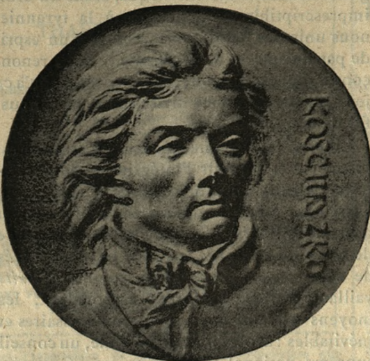
MÉDAILLON DE KOŚCIUSZKO par DAVID D'ANGERS.

Il se transporte en Suisse, à Soleure, où il passe ses dernières années dans la maison des Zeltner. Il meurt à Soleure le 15 octobre 1817.