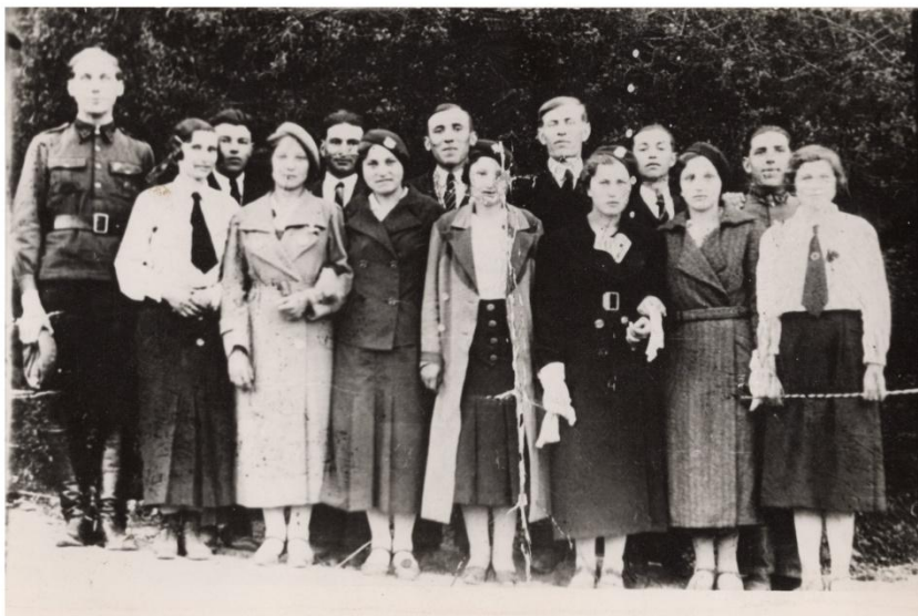
Panowice, ok.1937 r. grupa mieszkańców, wśród nich członkinie i członkowie Związku Strzeleckiego w Panowicach.

Nowy okupant również nałożył na ludność wiejską kontyngent – obowiązkowe dostawy zboża, żywca, ziemniaków, mleka i jaj. Zabroniono mieszkańcom przemiału zboża w młynach, a bydło i trzodę chlewną nakazano kolczykować. Dwa lata gospodarki sowieckiej i później równie rabunkowej niemieckiej, w połączeniu z powodzią doprowadziło we wschodniej Małopolsce do klęski głodu. Stąd też w 1942 r. przez Panowice przechodziły grupy wygłodniałych i wynędzniałych ludzi w poszukiwaniu żywności. Wielu z nich umierało w drodze 110 .