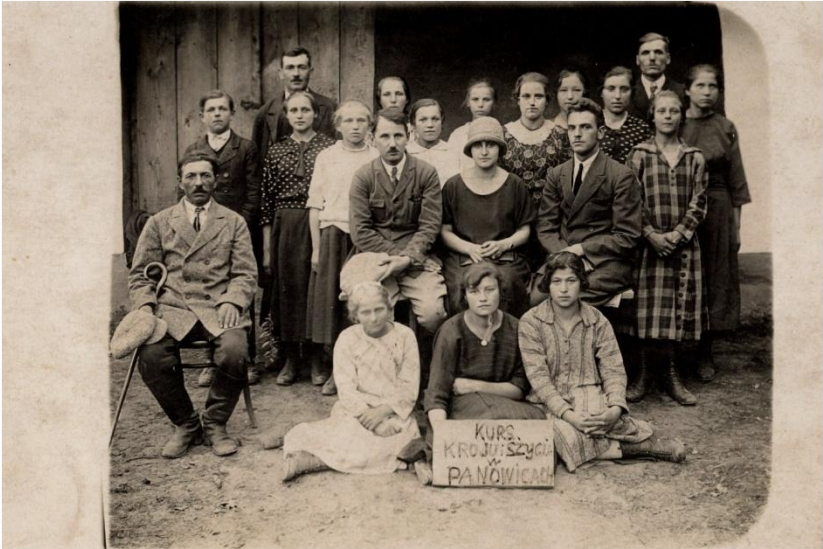
Kurs Kroju i szycia, lata dwudzieste XX w.

dzież strzelecka z Panowic wzięła udział w Drugim Marszu Zadwórzeńskim w 1928 r 72 . Z wielkim zaangażowaniem młodzieży szkolnej i organizacji strzeleckich organizowano akademie z okazji rocznicy Konstytucji 3 Maja, Święta Niepodległości 11 listopada, a także akademie z okazji imienin Marszałka Józefa Piłsudskiego 19 marca.