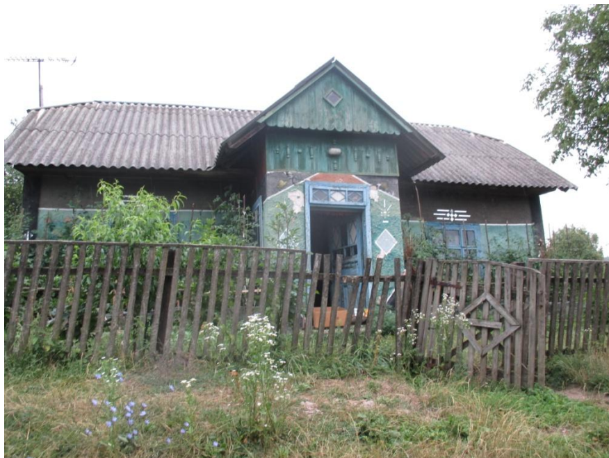
Ocalałe domy z okresu międzywojennego. Stan z 2015 r.

sznurki. Tytoń suszono w przygotowanych przewiewnych suszarniach. Osobnym procesem był zbiór warzyw i owoców, który przeciągał się do jesieni.