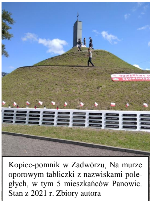
Kopiec-pomnik w Zadwórz, Na murze oporowym tabliczki z nazwiskami poległych, w tym 5 mieszkańców Panowic. Stan z 2021 r.

Kilkunastu Panowiczian odpowiedziało na apel władz polskich wstępując do policji lub wojska 91 .