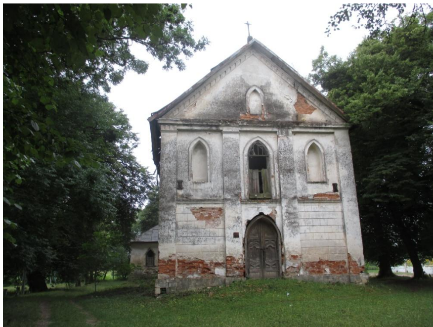
Kościół w Hnilczu z końca XIX w. służył mieszkańcom Panowic, od 1925 r. parafialny. Stan z 2015 r.

nych, zwłaszcza od strony północnej i wschodniej, rozciągały się tzw. „sianożęta” czyli rzadki las porośnięty drzewami liściastymi z dużymi połaciami trawy 34 .