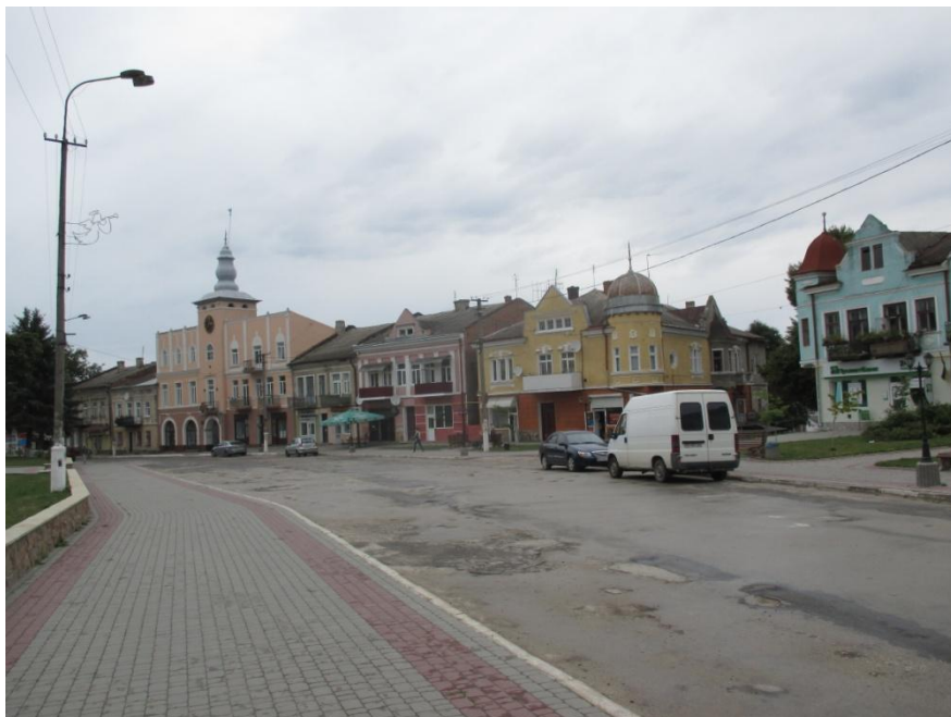
Podhajce, rynek z ratuszem, stan z 2015 r.

golarzy 15 bednarzy, 5 blacharzy, 2 kapeluszników, 2 zegarmistrzów, 1 malarz pokojowy, 5 powroźników i 1 złotnik oraz 5 domów zajezdnych i kilkanaście szynków 17 .