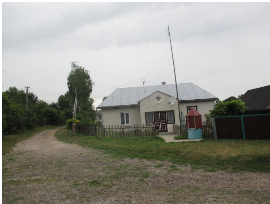
Ocalałe domy z okresu międzywojennego. Stan z 2015 r.