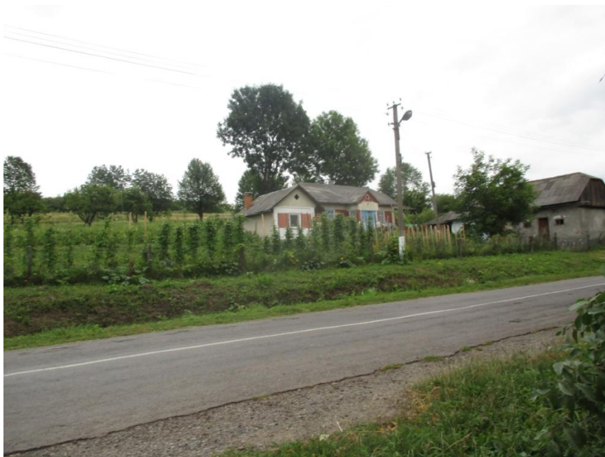
Ocalałe domy z okresu międzywojennego. Stan z 2015 r.

Sługocki podaje, że 1 sierpnia 1944 r. mieszkały w Panowicach 473 osoby.