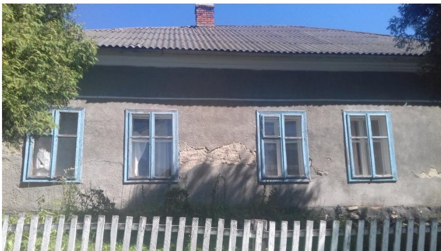
Budynek szkoły Panowicach, dziś świetlica. Stan z 2015 r.