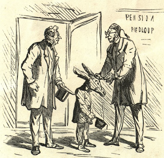
LA RENTRÉE EN PENSION. — Soyez sans inquiétude sur l'éducation de monsieur votre fils. Je vous le rendrai tel que je l'ai reçu.