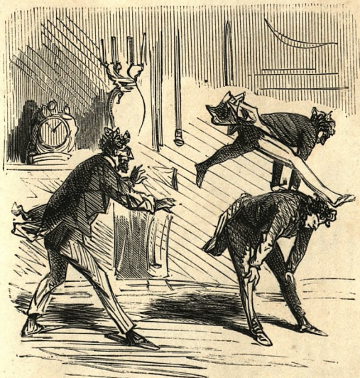
Le baccarat défendu dans les cercles.