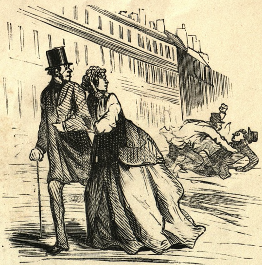
— Ah! mon Dieu! feraient-ils partie de la Société des gens de lettres?