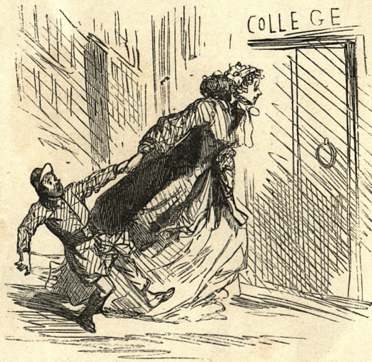
« Rendez les enfants à leurs mères, » dit la romance. Au bout de deux mois de vacances, elles préférèrent encore les rendre à leur proviseur.