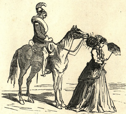
Les dames utilisant leur coiffure pour porter du fourrage à la cavalerie.