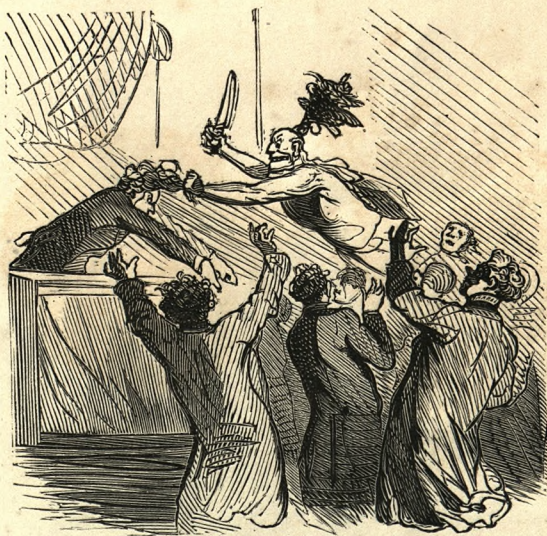
Un Peau-Rouge se faufilant au milieu de la Société des gens de lettres pour scalper le président.