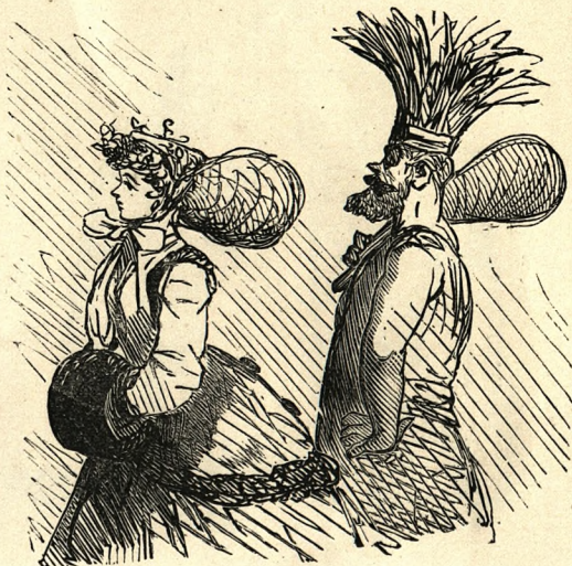
Singulier rapprochement à l'époque du mardi gras.