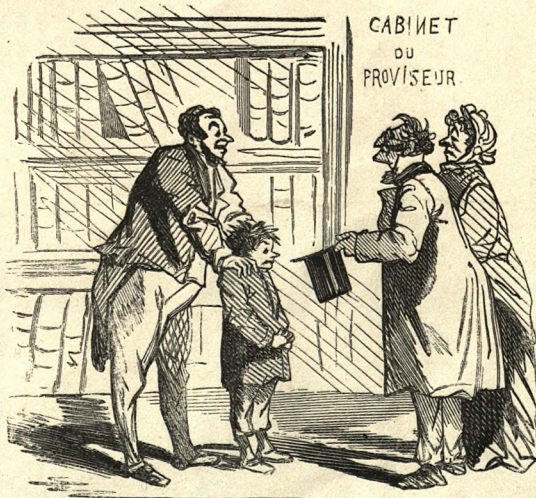
— D'après le nouveau décret, le collège va faire changer d'air à votre fils. — Monsieur le proviseur, notre enfant n'a jamais quitté ses parents. Pourriez-vous nous faire changer d'air en même temps ?