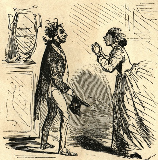
— Ah! mon ami! d'où viens-tu dans c't état-là? — Ma chère, nous avons eu réunion à la Société des gens de lettres.