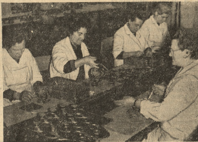
„Tonsil” jest najbardziej znany z produkcji głośników.

Nie mamy na szczęście w kraju mafii, ani znanych z amerykańskich filmów gangsterów noszących przy sobie całe arsenale. Mamy jednak i my — nie tytuł to do dumy — swojego „Ojca Chrzestnego”.