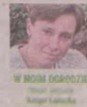
W MOIM OGRÓDZIE Pracownia Krzysztof Łabacki

Sadząc rośliny cebulowe w donicach musimy pamiętać o drenażu. Najlepszy będzie keramzyt. Jeśli go nie mamy, wykorzystać możemy drobne kamyczki czy kawałki cegieł. Materiał układamy na dnie donicy. Warstwa powinna wynosić około 10 centymetrów. Donica, w której sadzimy rośliny, na spodzie musi mieć wywiercone otwory, by nadmiar wody wypłynął z niej. Rośliny bulwiaste i cebulowe nie znoszą nadmiaru wody. Pod wpływem długotrwałej wilgoci zaczynają chorować i gnić. Kiedy mamy przygotowany drenaż, wsypujemy ziemię. Nigdy nie używamy tej z poprzedniego roku. Ona jest już jałowa. Rozrzucmy ją na rabaty i zaopatrzmy się w świeżą. Ostatnim etapem będzie sadzenie cebul. Tutaj postępujemy tak samo jak w przypadku cebul sadzonych na rabatach.