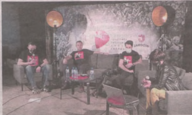
Konferencja prasowa zorganizowana została w Spichlerzu Polskiego Rocka