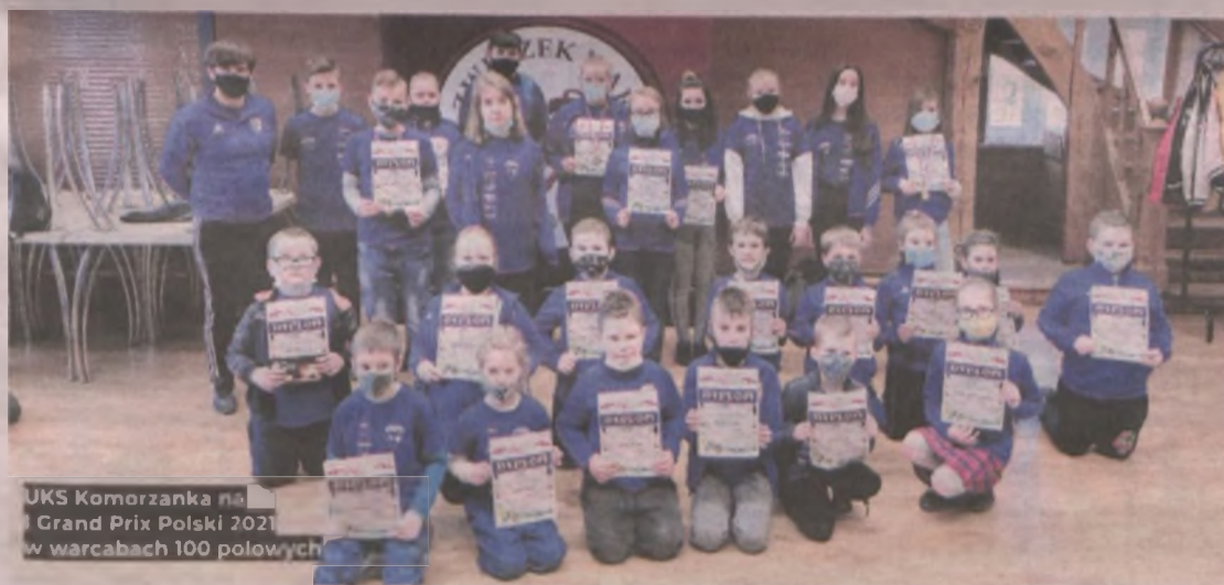
UKS Komorzanka na Grand Prix Polski 2021 w warcabach 100 polowych