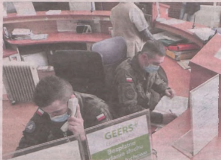
Praca w konsoli holu głównego jarocińskiego szpitala to dla żołnierzy służba na pierwszej linii frontu