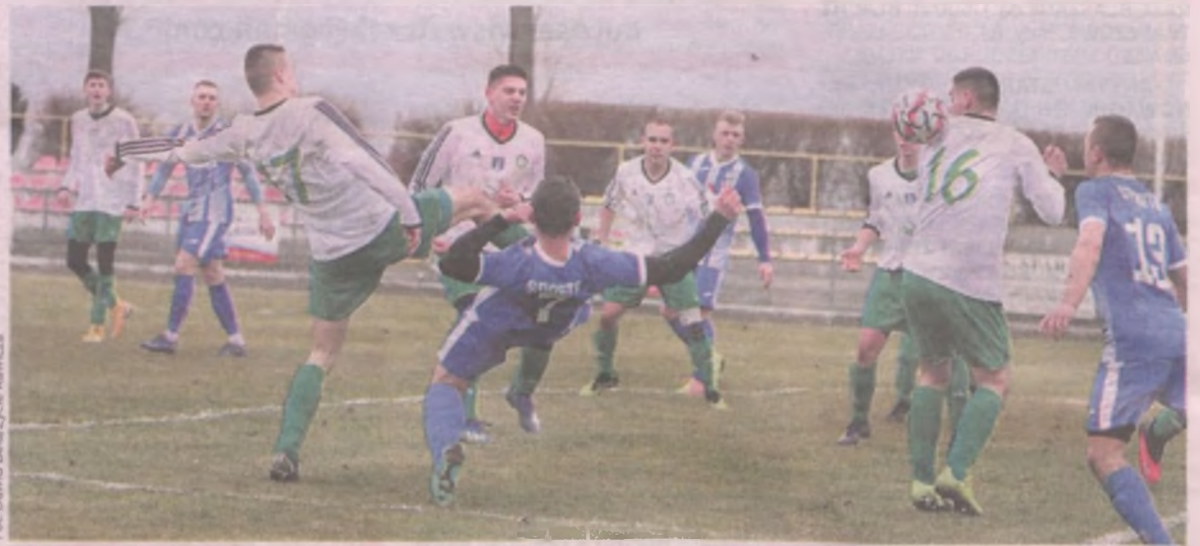
Piłkarze Phytopharmu Kleka (białe stroje), dzięki ambitnej postawie, przywieźli niespodziewanie komplet punktów z Miejskiej Górki