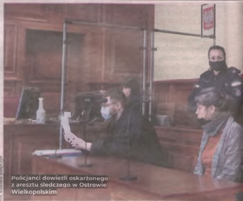
Policjanci dowieźli oskarżonego z aresztu śledczego w Ostrowie Wielkopolskim

nu o recydywę podstawową (zachodzi, gdy sądzony sprawca za przestępstwo umyśle popełnił już podobne i był za nie skazany - przyp. red.). Oskarżony wstaje z ławy i łamaną polszczyzną mówi, że chciałby jeszcze coś powiedzieć. Zaczyna nieskładnie mówić, że jeszcze przed wypadkiem próbowa- no go zabić. Ostatecznie przez tłumacza przekazuje, że przed zdarzeniem został pobity, podano mu narkotyki. - Przypalano mnie papierosem, a potem poddu- szano - przekazuje tłumaczka, a oskarżony na szyi pokazuje, jak go duszono. Z relacji męż-