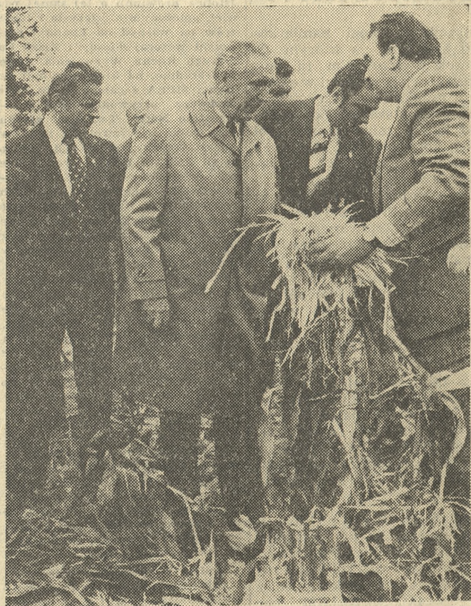
Na jednym z pól w Grabowie Królewskim.