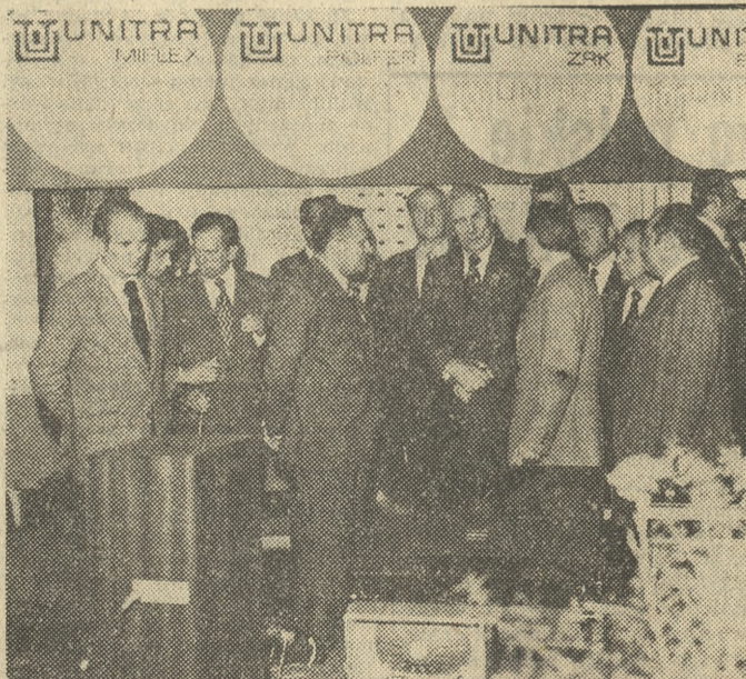
Podczas zwiedzania ekspozycji „Unitra”.