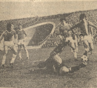
Z tej akcji Lech uzyskał prowadzenie.