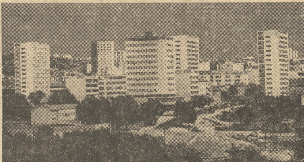
Split. Miasto nad Adriatykiem, drugi pod względem wielkości przeładunków port morski Jugosławii, szczyty się także przepiękną architekturą, podziwianą co roku przez licznych turystów zagranicznych.