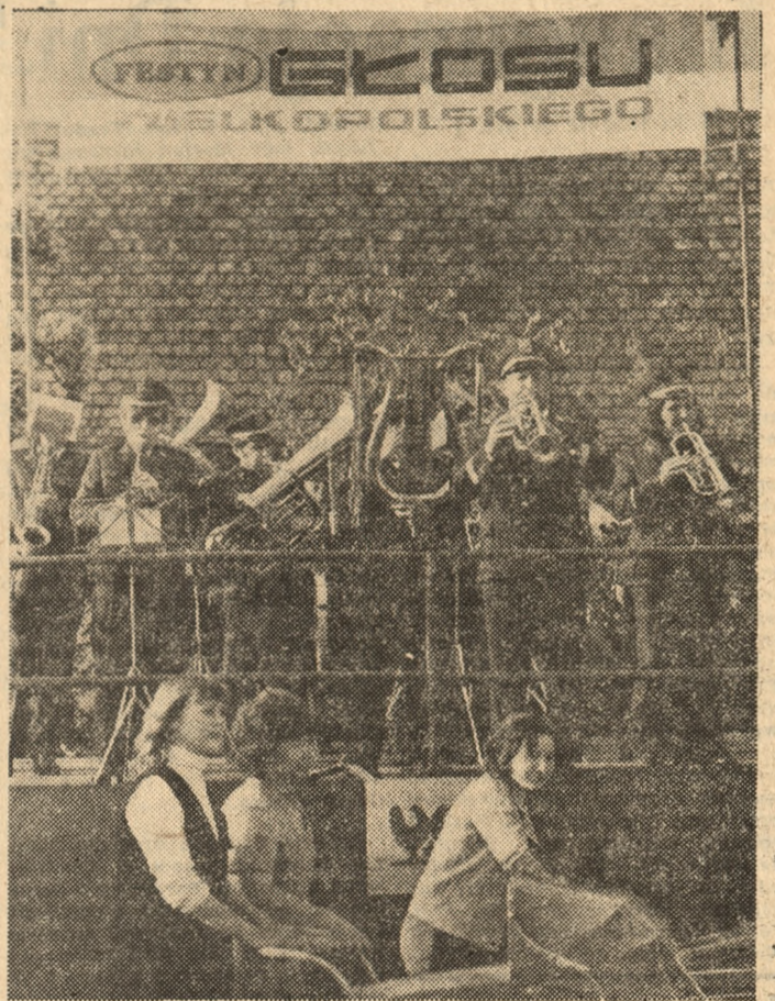
Koncertuje orkiestra Ogniska Muzycznego ze Śremu.