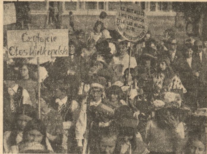
Barwny pochód młodzieży szkolnej z Dolska był oznaką rozpoczęcia festynu.

w pomysłowych strojach i kostiumach z różnych epok. Uczestnicy pochodu przygotowali m. in. wiele sympatycznych hasel propagujących nasz dziennik, z których największą popularność zyskało: „Miasta, miasteczka oraz wio-