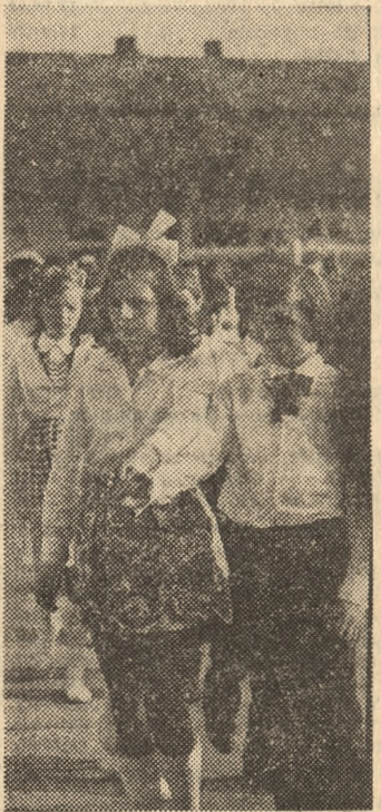
Pierwsze pary poloneza.

Festyn rozpoczął się w sobotę popołudnie. Na otwarcie przybyli m. in. kierownik Wy-