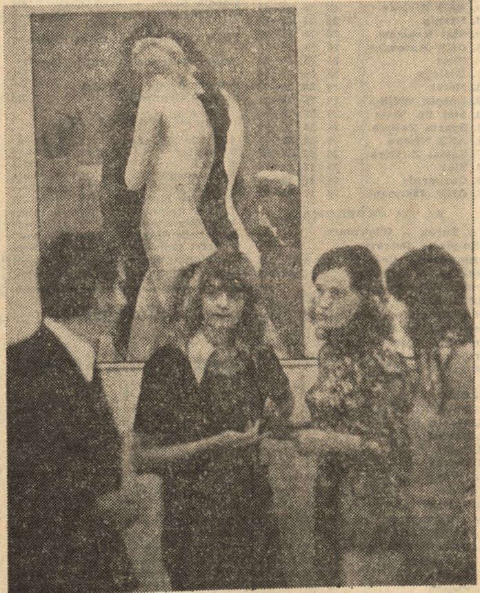
Na wystawie malarskiej w Dolsku toczyła się niejedna dyskusja o sztuce.