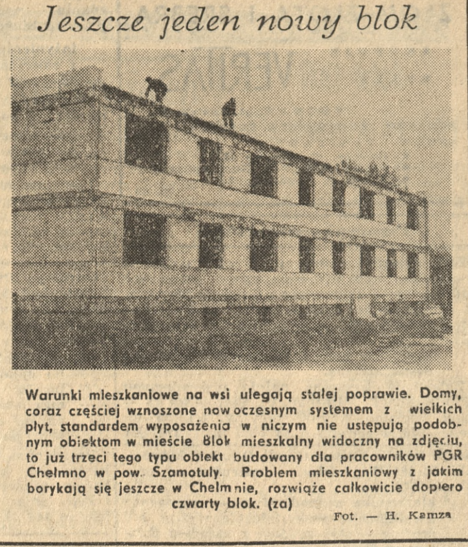
Jeszcze jeden nowy blok. Warunki mieszkaniowe na wsi ulegają stałej poprawie. Domy, coraz częściej wznoszone nowoczesnym systemem z wielkich płyt, standardem wyposażenia w niczym nie ustępują podobnym obiektom w mieście. Blok mieszkalny widoczny na zdjęciu, to już trzeci tego typu obiekt budowany dla pracowników PGR Chelmno w pow. Szamotuły. Problem mieszkaniowy z jakim borykają się jeszcze w Chelmie, rozwiąże całkowicie dopiero czwarty blok. (za)

będzie możliwość nabycia biletu w niektórych kioskach „Ruchu”. Sieć tych punktów będzie systematycznie powiększana. Rozważa się też projekt wykorzystania niektórych klubów-kawiarni (tam, gdzie to jest możliwe), na lokalne dworce autobusowe. Bezpieczeństwo pasażerów zapewnią budowane przy drogach zatoki, a stale rosnąca liczba wiat i przystanków pozwoli na w miarę wygodne oczekiwanie na pojazd. Ten postulat w pełnym stopniu spełnią nowe dworce. Dobiaża końca budowa nowoczesnego obiektu w Kaliszu: podobny powstaje w Obornikach, a w przygotowaniu są projekty dworców w Lesznie, Śremie i Koninie. (za)