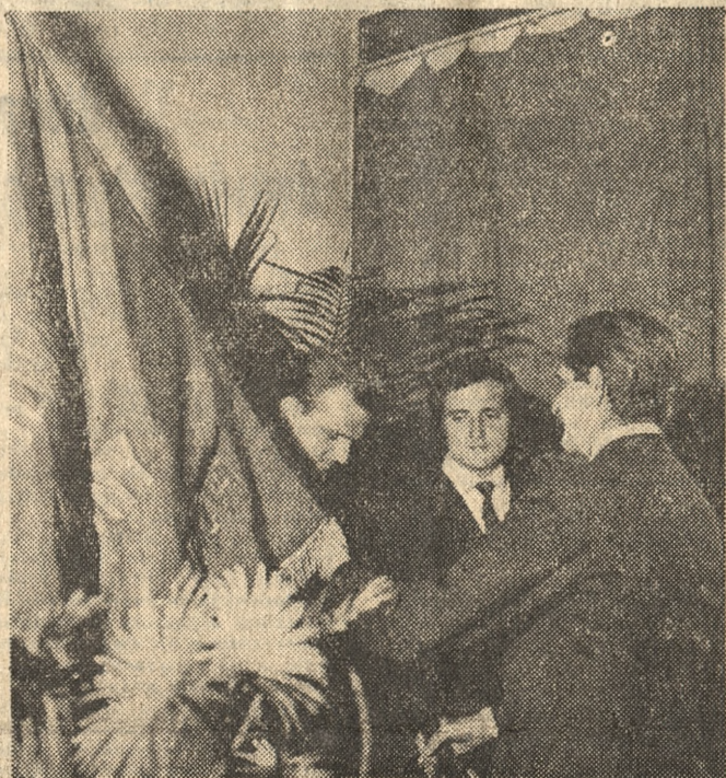
Na zdjęciu: moment przekazania sztandaru.

Sztandar ten przekazał wczoraj zwycięskiej załodze Żydowa na posiedzeniu KSR zastępca członka Biura Politycznego KC PZPR minister rolnictwa — Kazimierz Barci-