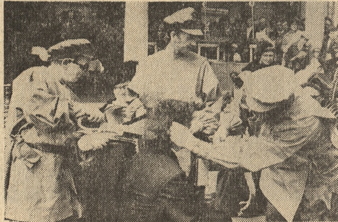
Na zdjęciu: scena z drukarskich otręsin. Nim adept czarnej sztuki zostanie wyzwolony, musi poddać się wszechstronnemu egzaminowi.

Francuskie Ministerstwo Spraw Wewnętrznych przekazało wczoraj po południu ostateczne wyniki I tury wyborów prezydenckich, obejmujące rezultaty głosowania w metropoli i departamentach i terytoriach zamorskich. Według tych informacji F. Mitterrand otrzymał 43,37 procent głosów, Valery Giscard d'Estaing 32,70 procent głosów, a Jacques Chaban-Delmas 15,15 procent głosów.