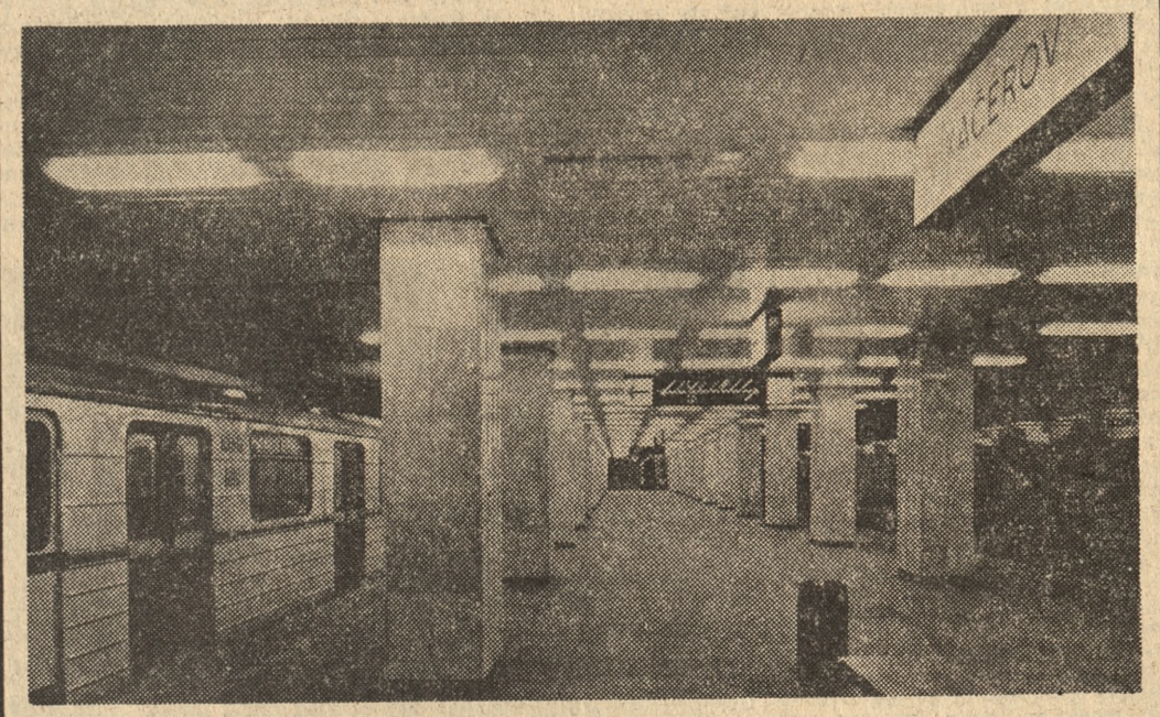
9 maja uruchomiona zostanie pierwsza linia metra budowane go obecnie w Pradze. Na zdjęciu: jedna ze stacji metra — Kacerov.