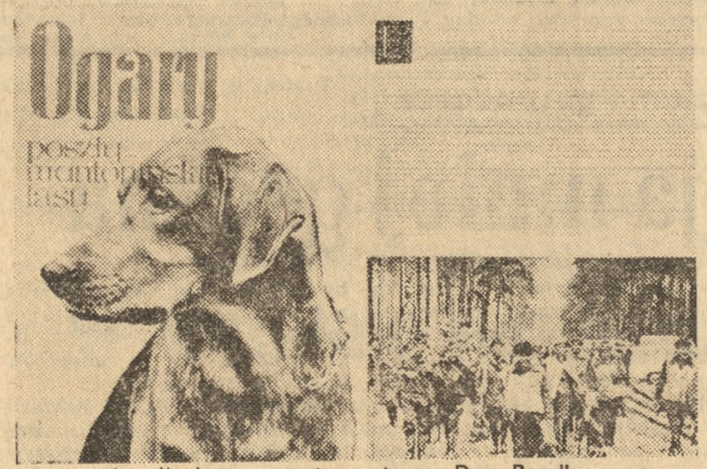
Na zdjęciu — wewnętrzne strony „Darz Bór”.