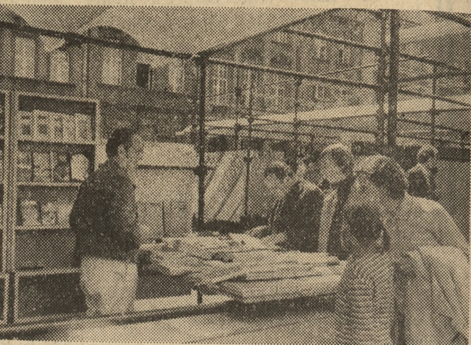
Stoisko z książkami.