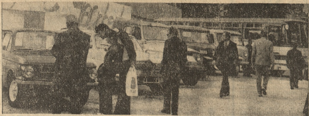
Fragment stoiska radzieckiej motoryzacji na tegorocznych MIT w Poznaniu.