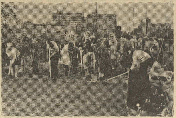
Na zdjęciu: pracownice Dzielnicowego Zarządu Służby Zdrowia na Grunwaldzie wykonują wiosenne prace na trawnikach wzdłuż ul. Hetmańskiej.

Pracownice Dzielnicowego Zarządu Służby Zdrowia, podobnie jak ich koleżanki z innych dzielnic Poznania, w minioną niedzielę przystąpiły do realizacji czynu społecznego. Wypiękniali Poznań, wypiękniali miasto, wsie i osady w całej Wielkopolsce, bowiem wszędzie kobiety przystąpiły do prac porządkowych i ulepszczeniowych na rzecz swojego osiedla, zakła-