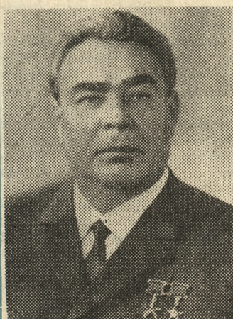
Leonid Breżniew, sekretarz generalny KC KPZR.

W DNIU DZISIEJSZYM NA ZAPROSZENIE KOMITETU CENTRALNEGO POLSKIEJ ZJEDNOCZONEJ PARTII ROBOTNICZEJ, RADY PAŃSTWA