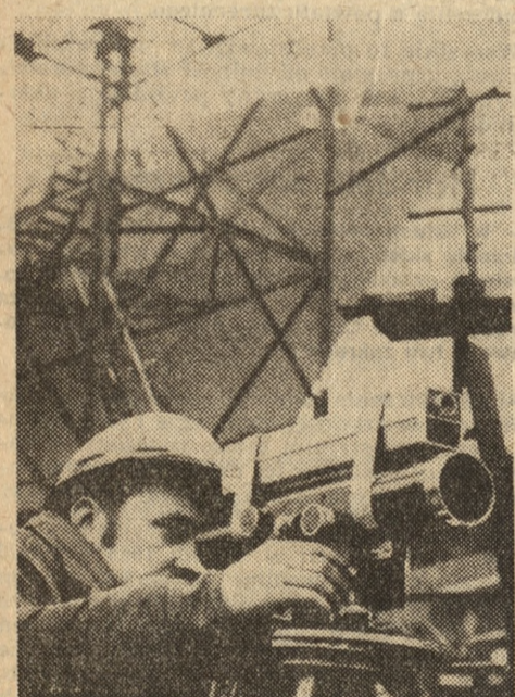
Tak wygląda precyzyjny nrwielator sprzeczony z laserem gazowym.

* Pisyaliśmy o tych sprawach w numerze 84 „Głosu” w artykule pt. „Mieszkań 56 tysięcy“.