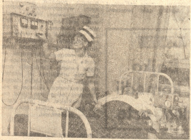
Pielęgniarka za pomocą elektrokardioskopu kontroluje pracę rozrusznika utrzymującego chorą przy życiu.