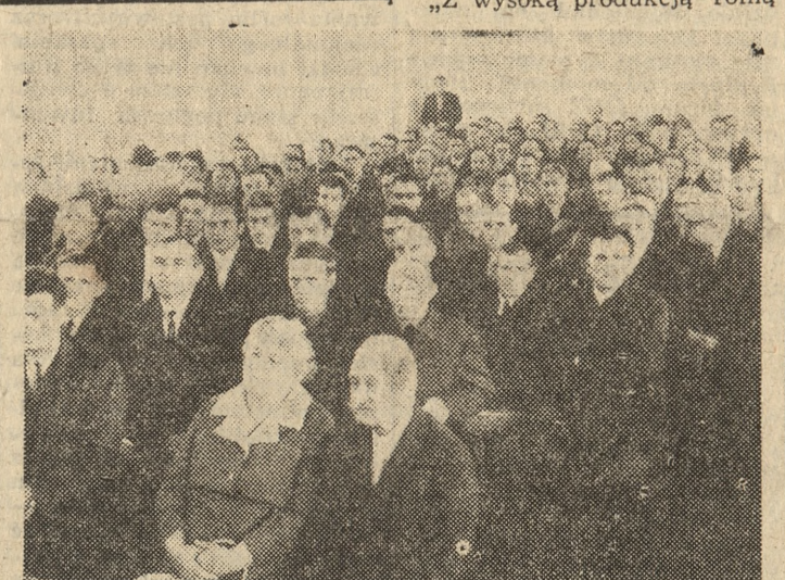
Fragment sali obrad podczas spotkania rolników gnieźnieńskich.

„Będzie z pewnością przeprowa- dzona ratyfikacja układów o przystąpieniu Wielkiej Brytanii i in- nych państw do EWG. Zbliży się ratyfikowanie układów z Moskwą i Warszawą. Owocna polityka od- preżeniowa rządu federalnego stwarza Bundestagowi możliwość ratyfikowania tych układów. Bun- destag stoi więc w najbliższych miesiącach w obliczu obszernego programu, którego urzeczywistnie- nie będzie wymagało skoncentro- wanej pracy w komisjach i we frakcjach”. (PAP)