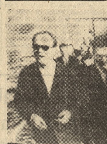
Na zdjęciu: L. Breźniew (z prawej) i W. Brandt podczas przechadzki na moło nad brzegiem Morza Czarnego, po zakończeniu rozmów.

Ostatnią wystawą z cyklu jubileuszowych ekspozycji 25-lecia okręgu ZPAP w Poznaniu, prezentujących dorobek poszczególnych sekcji Związku jest otwarta wczoraj w „Arsenale” wystawa Sekcji Architektury Wnętrz poznańskiego ZPAP pt. „Funkcja, Nowoczesność, Poznań”. Prezentuje ona ponad 200 prac: projekty gotowych realizacji i propozycje studyjne z myślą o wykorzystaniu ich w architekturze Poznania oraz przedmioty z dziedziny rzemiosła i wzornictwa artystycznego. (ob)