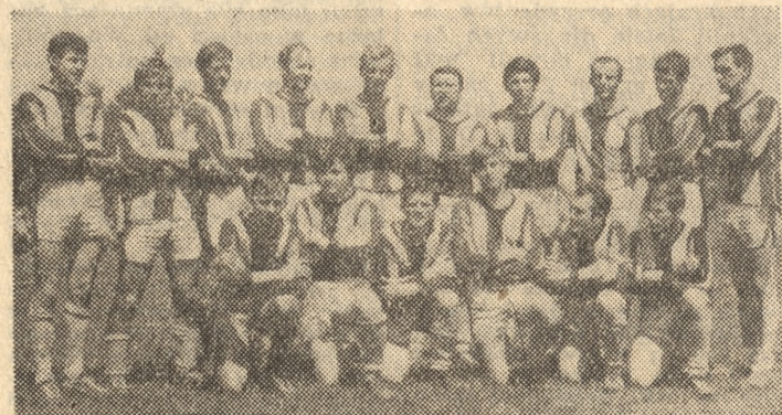
Międzynarodowy turniej rugby zorganizowany z okazji 50-lecia istnienia KS Polonia Poznań wygrała drużyna gospodarzy. Polonia zwyciężyła we wszystkich trzech pojedynkach z Lokomotivem Lipsk, Diskiem (CSRS) i Rugby Club Kopenhaga.