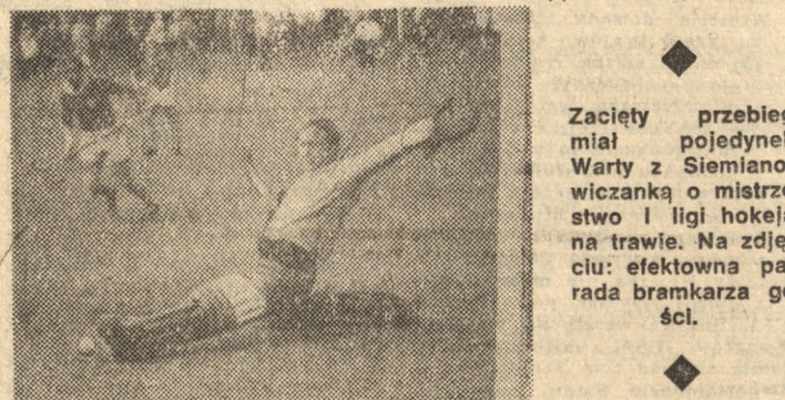
Zaciekły przebieg miał pojedynek Warty z Siemianowiczanką o mistrzostwo I ligi hokeja na trawie. Na zdjęciu: efektowna parada bramkarza gości.