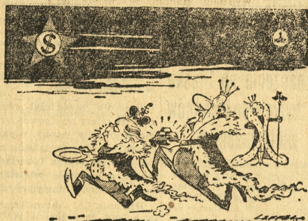
Wyścig do gwiazd