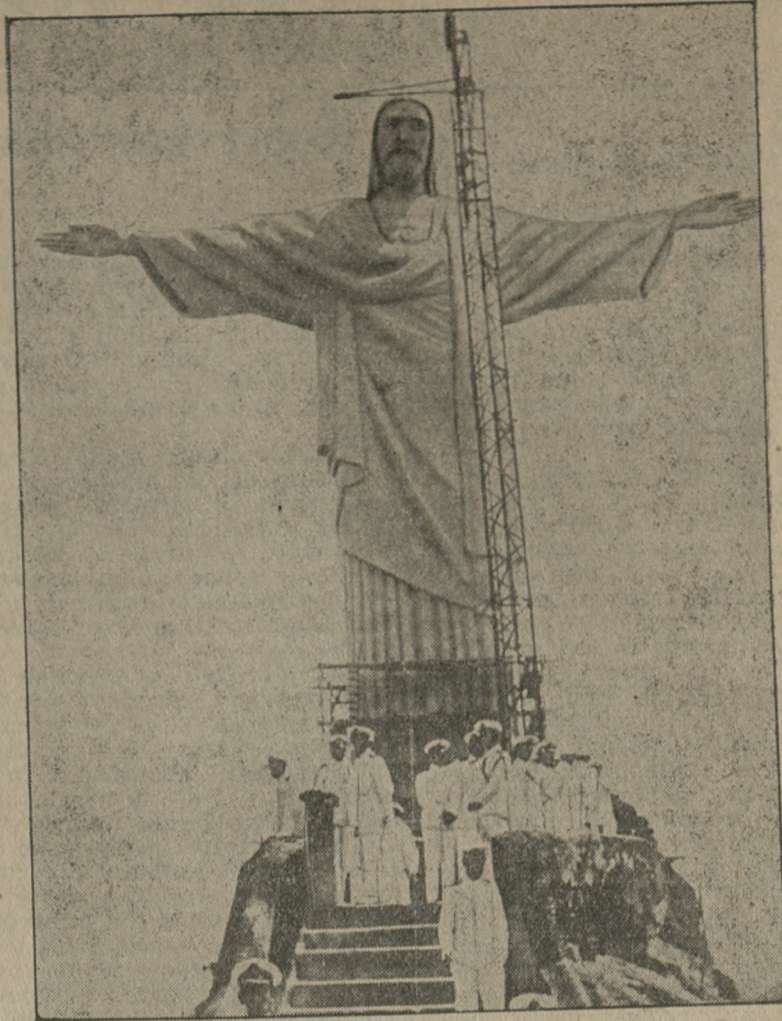
Olbrzymi posąg Chrystusa u wejścia do portu w Rio de Janeiro, który w tych dniach został odsłonięty. Oświetlenia elektrycznego, jak wiadomo, dokonał po raz pierwszy słynny wynalazca Marconi ze swego laboratorium we Włoszech. Wysokość posagu wynosi 39 metrów.

Znajdujące się w bliskości opisanego gmachu t. zw. Inda House, rozciąga przed nami bajeczne wspaniałości egzotycznego Wschodu. Białe sklepienia sufitów, misternie rzeźbione balustrady i bramy, mallowidła ściennie znakomitych artystów hinduskich, herby ziem indyjskich, widniejące w rzadkich marmurach pod naszymi stopami, iskrzące się tysiącami światła, zwisające z wysokości kopuły lustro — wszystko to jest stylowe i nieporównane. Gdyby wycisnąć inne tego rodzaju przybytki handlu i przemysłu, domy bankowe, wielkie towarowe magazyny i modne siedziby przerożnych instytucji, rejestr urósł by bardzo długi. Trzeba się przeto ograniczyć do stwierdzenia, że najnowsze twory angielskiego budownictwa nuzacemu jednostajnością Londynowi nadają powab nie zwyczajny i w wysokim stopniu atrakcyjny. Spectator.