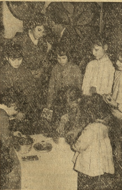
Przy tej konkurencji dziewczynki wykazują więcej cierpliwości niż chłopcy. Oddzielenie gróchu od fasoli wymaga nie tylko zręczności, ale głównie cierpliwości. Kto prędzej dokona selekcji otrzyma nagrodę.