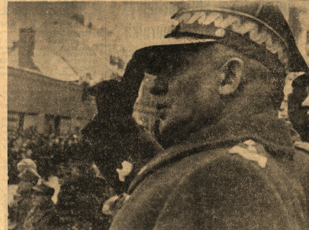
Generał Karol Świerczewski na trybunie w Gnieźnie.