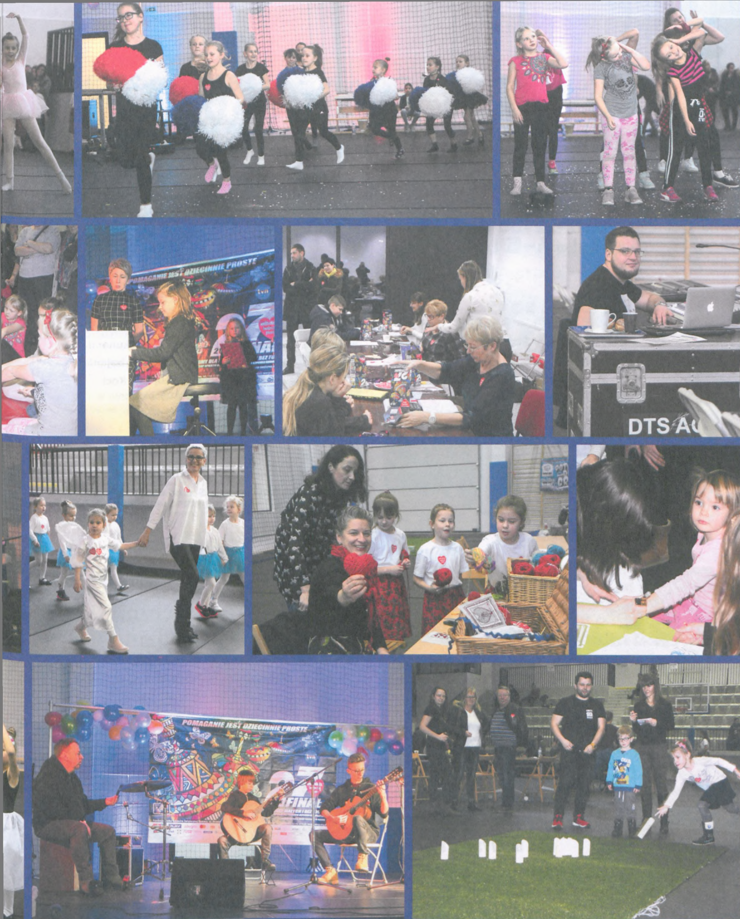
Więcej zdjęć: facebook.com/Biblioteka-Miejska-Centrum-Animacji-Kultury-w-Puszczykowie