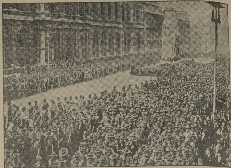
4.000 harcerzy angielskich zebrało się u pomnika ofiar wojny światowej, celem uczczenia pamięci poległych harcerzy.

Diament „Hope” waży 111 karatów i ma opinię, że przynosi wszystkim posiadaczom nieszczęście. Kamień ten był ongiś okiem jakiegoś bożyszcza w Indjach. Skradł go pewien francuski awanturnik i ofiarował królów francuskiemu Ludwиковi XIV. Przez sto lat był pierścień w posiadaniu Bourbonów a potem stanął ozdobą diademu królowej Marii Antoniny.