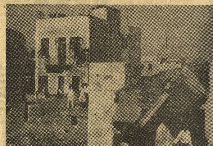
Zniszczone w początkach września przez izraelskie pociski artyleryjskie domy mieszkalne w dzielnicy Suez — Arba-len.