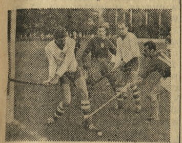
Na zdjęciu powyżej: fragment meczu Francja — Czechosłowacja rozgrywanego w Poznaniu w ramach międzynarodowego turnieju z okazji 40-lecia PZHT. Główny moment pod bramką CSRS wyjątna w ostatniej chwili obrońca czechosłowacki.

Pierwsza drużyna Polski (zdjęcie poniżej) pretenduje do zajęcia czołowego miejsca w turnieju.