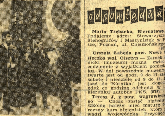
Mocne uderzenie na Rynku Jeżyckim.