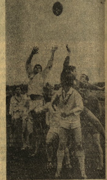
Dwie poznańskie drużyny zainaugurowały tegoroczny sezon rugby. Pierwsze spotkanie Polonii z Poznaniem zakończyło się zwycięstwem lepiej przygotowanego zespołu Polonii 14:6 (11:3).

Cięharowiec Szwecji pokonali w meczu międzypaństwowym w Sztokholmie NRD 5:2. Koszykarki ZSRR przebijające w USA pokonały zespół Nashville Business College 50:35.