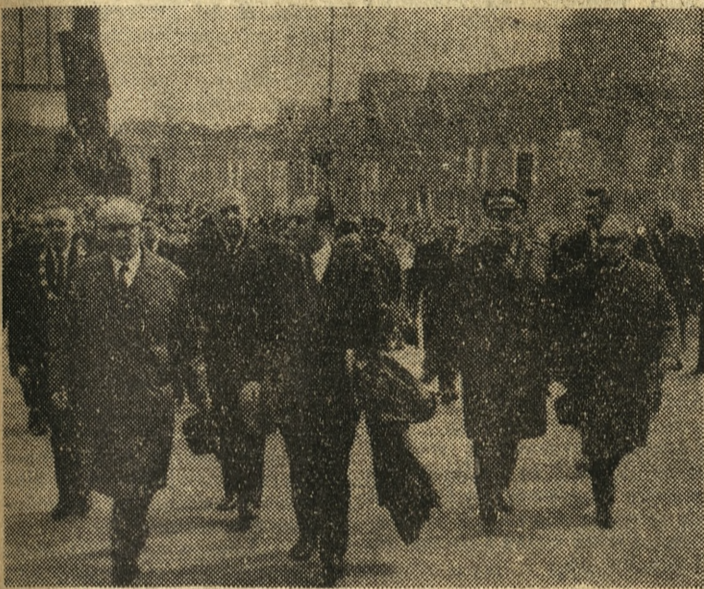
Witani gorącymi oklaskami na trybunie wchodzi członkowie prezydium wiecu z Władysławem Gomułką na czele.

organizacji społecznych i zakładów pracy.