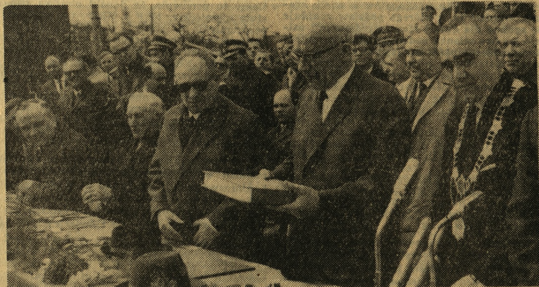
Nie przyszliśmy na wiec z pustymi rękami... Oto księga zobowiązań wartości 1,3 miliarda złotych podjętych przez społeczeństwo Poznania i Wielkopolski dla uczczenia 1000-lecia Państwa Polskiego. Złożono ją na ręce Władysława Gomułki podczas niedzielnej manifestacji.

Role „przedmurza” chrześcijaństwa spełniała Rzeczpospolita szlachecka. Stanowiło to jedno z głównych źródeł jej słabości, wskutek czego protestancko-katolickie Prusy, prawosławna Rosja i katolicka Austria dokonały jej rozbiórów. Dopiero socjalistyczna rewolucja listopadowa w Rosji otworzyła narodowi polskiemu wrota do niepodległości. Ale także Polsce międzywojennej rządzące nią klasy wyzyskiwaczy, łącznie z hierarchią kościelną, narzuciły rolę „przedmurza”, jako antyradzieckiego bastionu. Skończyło się na tym, że przy błogosławieństwie katolickich