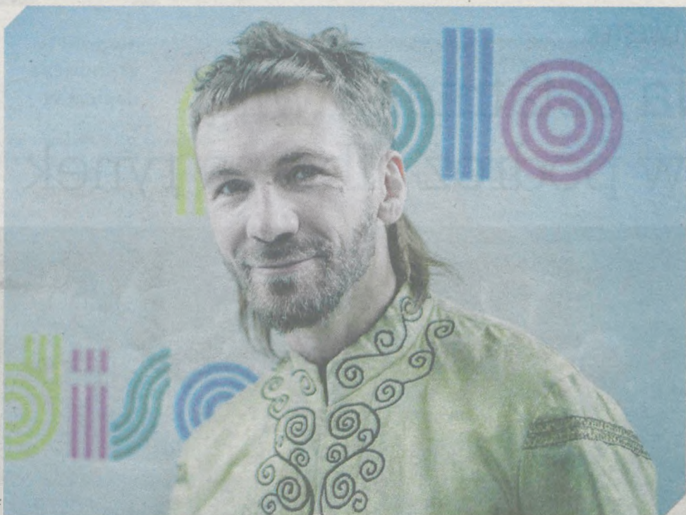
W estetyce Disco Polo na planie „Inicjacji”