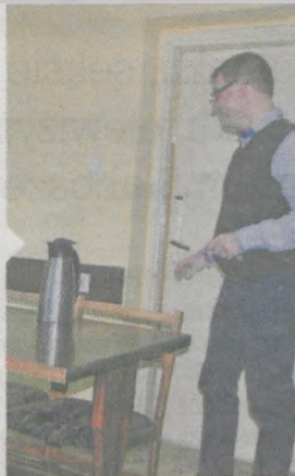
Sekretarz porzucił termos