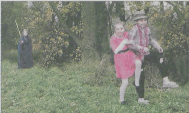
Fot. SP Magnuszewice