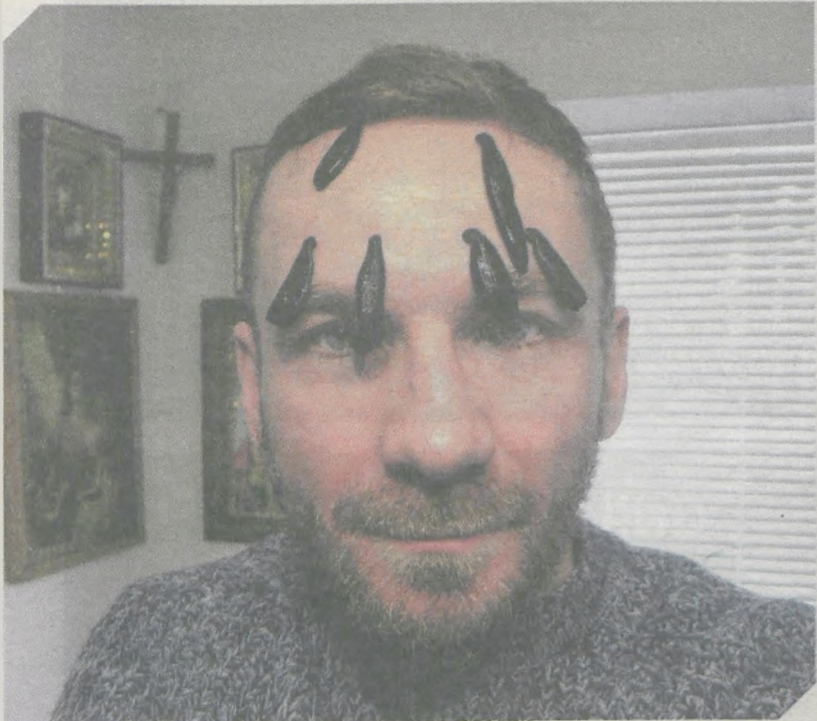
Leczenie przy pomocy pijawek to tylko jeden licznych eksperymentów, jakim poddał się na planie „Szóstego Zmysłu”