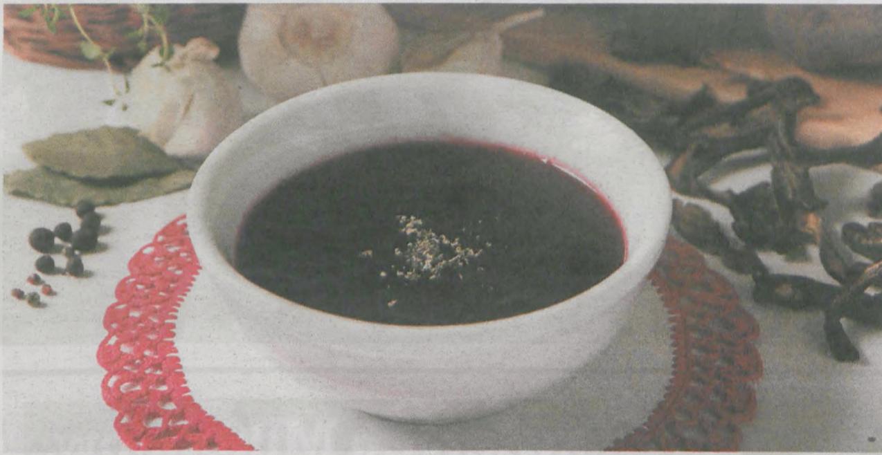
Barszcz czerwony, który można posmakować u członka Sieci Dziedzictwa Kulinarne Wielkopolska Restauracji Pod Niebieniem w Poznaniu

jak szczupak, karaś, czy właśnie karp. Ryby jadano najczęściej na dworach i w domach bogatych mieszczan, biedniejsi jedli natomiast śledzie.