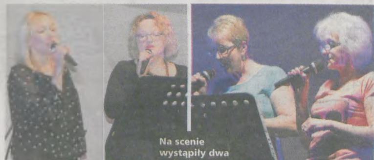
Na scenie wystąpiły dwa rodzeństwa i jedno małżeństwo