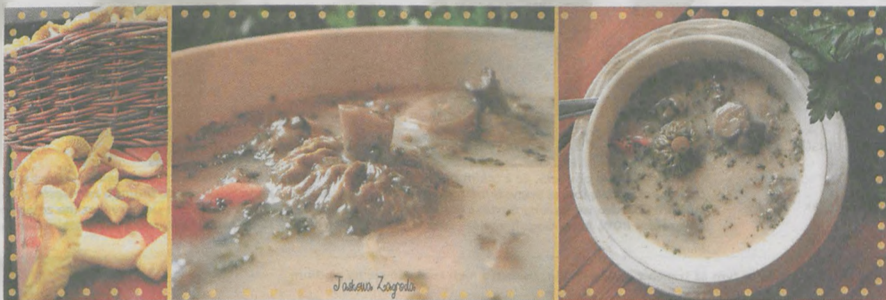
Tradycyjna zupa grzybowa, którą można spróbować u członka Sieci Dziedzictwa - restauracja Jaśkowa Zagroda

Po zupie czas na drugie danie. Mimo, że obecnie nie obowiązuje już post podczas Wigilii, to nie wyobrażamy jej sobie bez ryb, a w szczególności dań z karpia. Karp w wielkopolskiej kulturze, podobnie jak w całej Polsce, zajmuje od okresu międzywojennego miejsce głównej potrawy wigilijnego stołu, a podawany jest w przeróżnych postaciach: smażony, gotowany, podawany w galarecie. Uważa się, że właśnie podczas Świąt Bożego Narodzenia ta ryba smakuje najlepiej, choć odławiać ją można prawie przez cały rok. Kuchnia wielkopolska nie obfitowała w potrawy rybne. Właśnie dlatego, w wielu książkach kucharskich z Wielkopolski z minionych wieków, odnajdujemy potrawy jedynie z niewielu gatunków ryb takich,