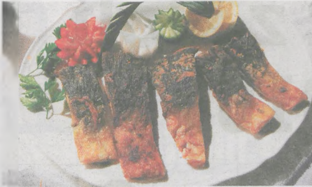
Karp smażony, który serwuje m.in. członek Sieci restauracja Gościniec Gryszczeniówka - Wargowo k. Obornik