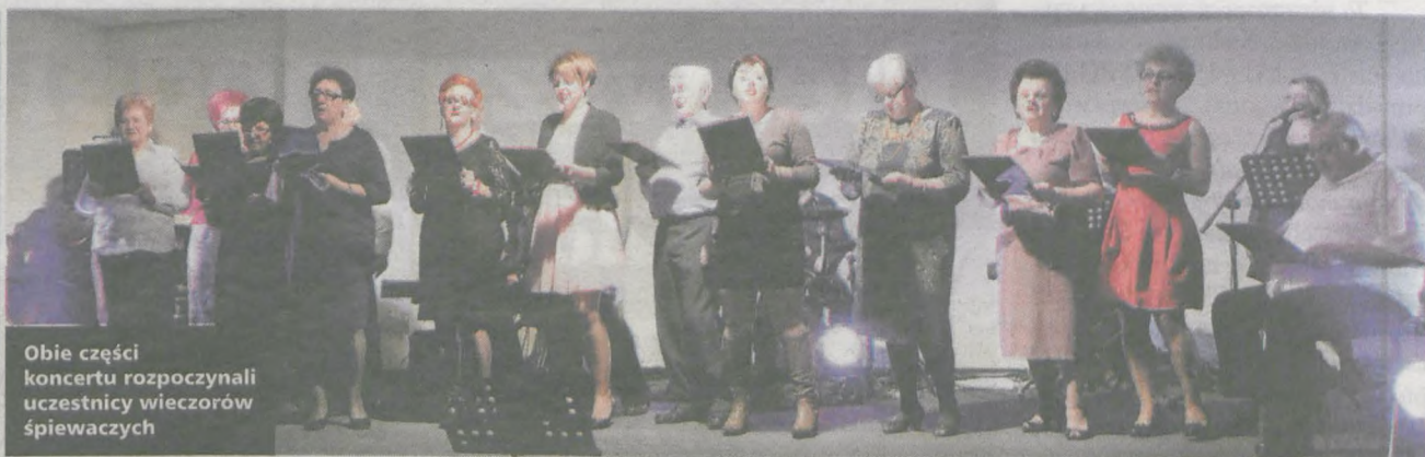
Obie części koncertu rozpoczęli uczestnicy wieczorów śpiewających