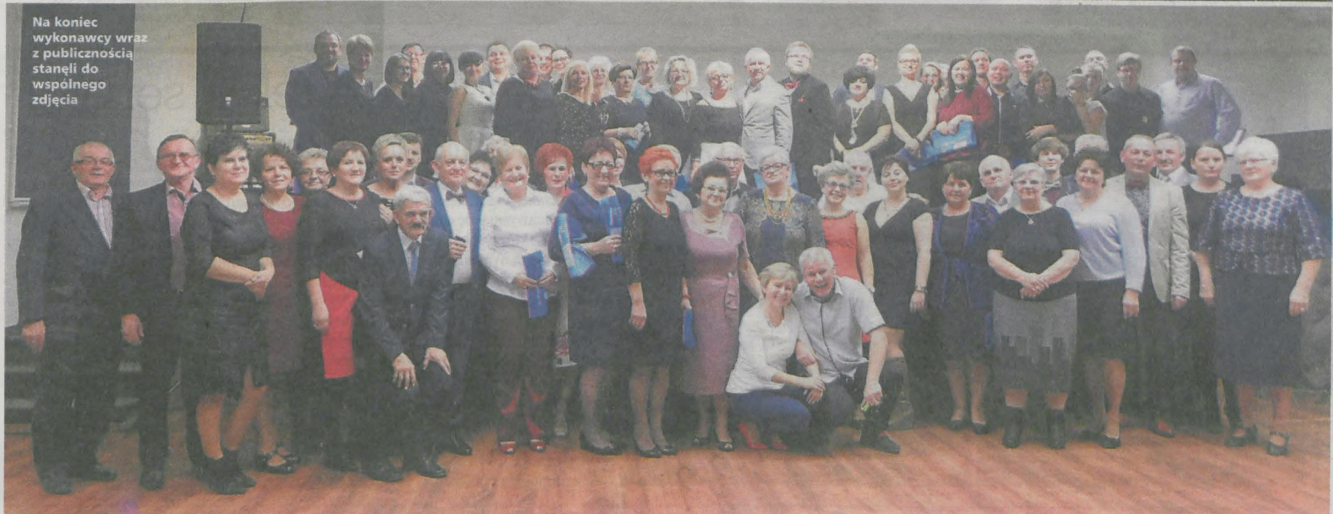
Na koniec wykonawcy wraz z publicznością stanęli do wspólnego zdjęcia