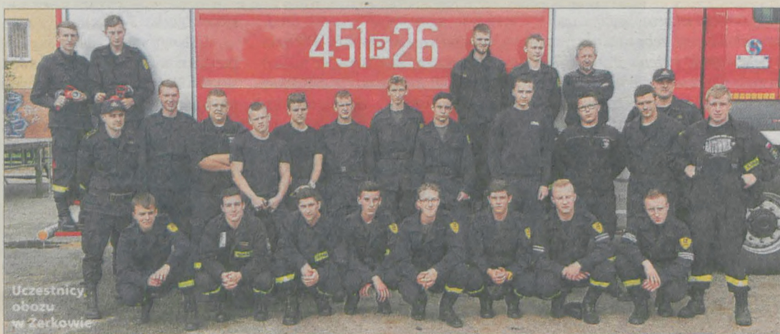
Uczestnicy obozu w Żerkowie