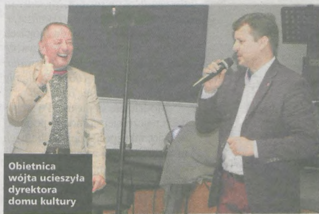
Obietnica wójta ucieszyła dyrektora domu kultury