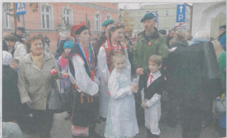
W zeszłym roku kwestowano na renowację pomników powstańców wielkopolskich, w tym roku zebrane pieniądze zostaną przeznaczone na nowy pomnik dla księdza Ignacego Niedźwiedzińskiego. Ci, którzy wrzucą datki, będą częstowani rogalami