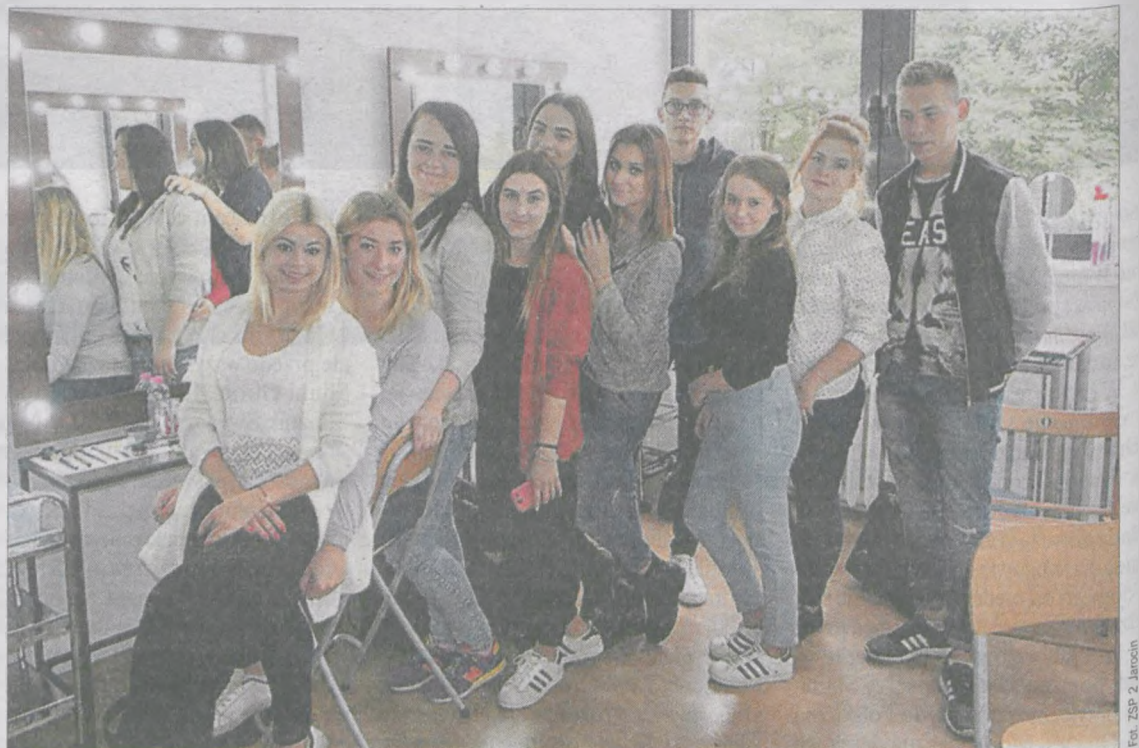
Reprezentacja uczniów Zespołu Szkół Ponadgimnazjalnych nr 2 w Jarocinie