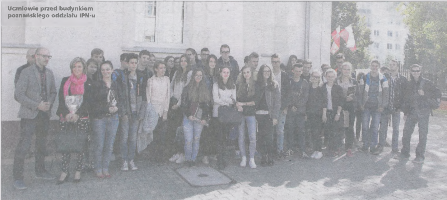
Uczniowie przed budynkiem poznańskiego oddziału IPN-u

Grupa uczniów biorących udział w projekcie „Odkryj bohatera”, organizowanym przez Fundację 750-lecia Jarocina, udała się do Instytutu Pamięci Narodowej w Poznaniu.