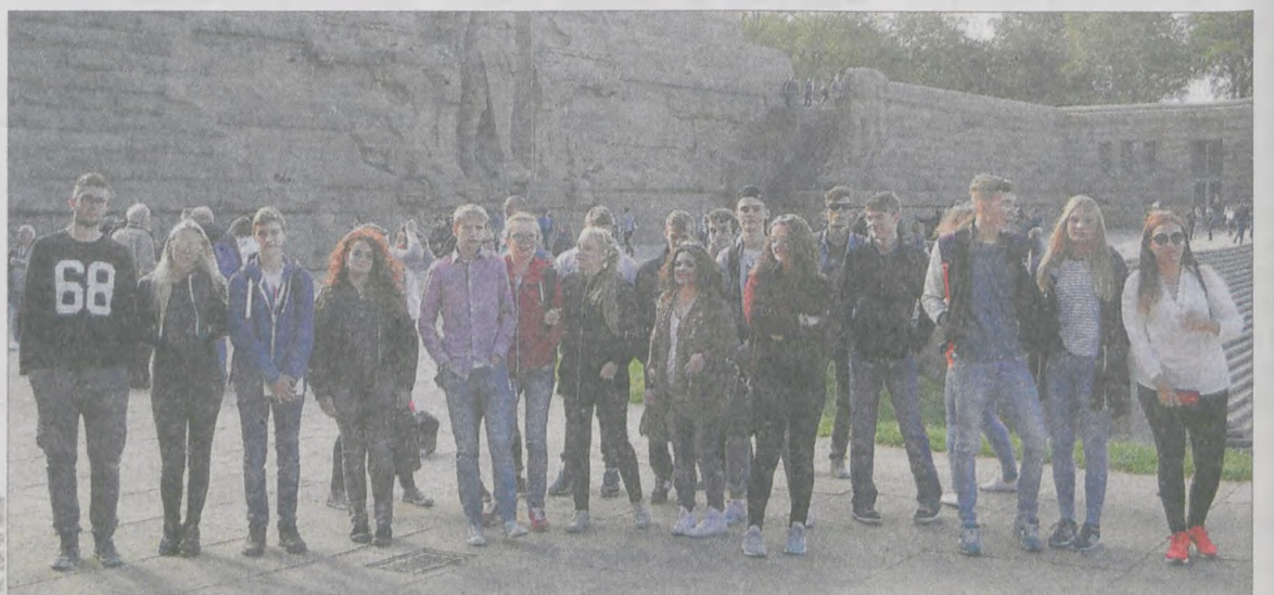
Uczestnicy spotkania stanęli do wspólnego zdjęcia