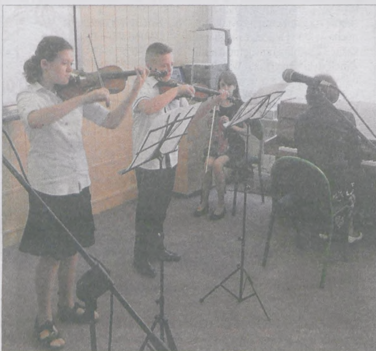
Dzieci na koncercie wystąpiły na galowo