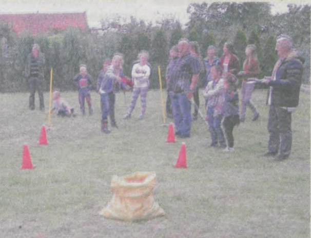
Przy chwilach sprzyjającej pogody w konkursach i zabawach uczestniczyli starsi i młodszy