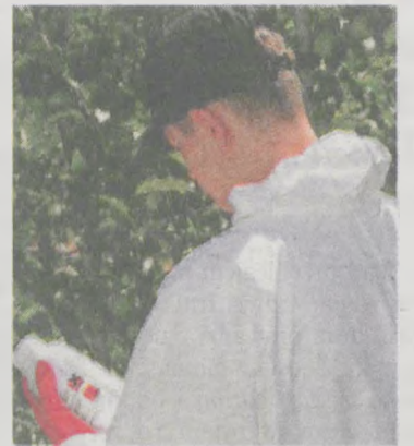
Sprawdzając piktogramy na etykiecie dowiesz się, które opakowania należy zwrócić

Należy pamiętać, że rolnik ma ustawowy obowiązek zwrotu opako-