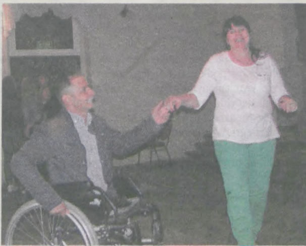
Zespół, który przygrywał do tańca, „porwał” wszystkich na parkiet