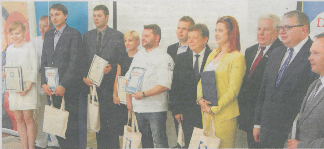
Nowi członkowie Sieci Dziedzictwa Kulinarnego Wielkopolska

Przykład Sieci Dziedzictwa Kulinarnego Wielkopolska pokazuje, że sukces w branży spożywczej nie zawsze musi wynikać z innowacji, postępu technologicznego i produkcji na masową skalę. Dobry produkt może powstać również w tradycyjnych warunkach, na bazie dobrze znanych, choć często zapomnianych przepisów. Walory smakowe i zdrowotne tak wytworzonej żywności są dla konsumentów nie do przecenienia. Zachęcamy producentów rolnych, przetwórców żywności, których wyroby powstają na bazie wielkopolskich surowców, a także restauracje, lokalne sklepy, które w swojej ofercie proponują wielkopolską, naturalną żywność, do przystąpienia do Sieci Dziedzictwa Kulinarnego Wielkopolska. Aby zostać członkiem Sieci, należy złożyć wniosek do Departamentu Rolnictwa i Rozwoju Wsi Urzędu Marszałkowskiego Województwa Wielkopolskiego w Poznaniu. Naprawdę warto!