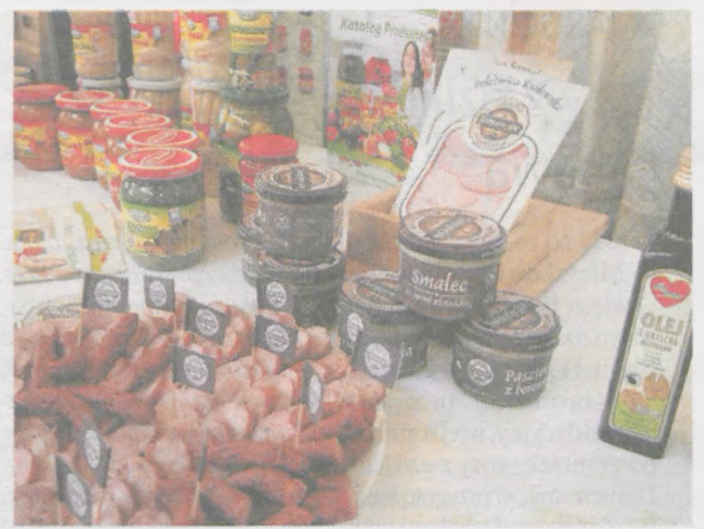
Produkty należące do sieci