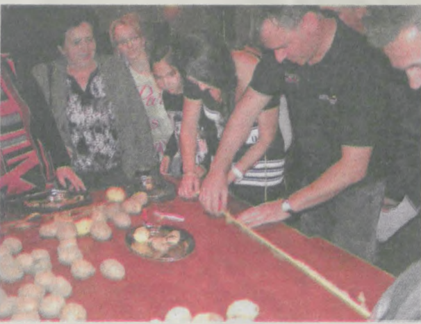
Mierzenie długości oberki musiało być bardzo dokładne, liczył się każdy milimetr