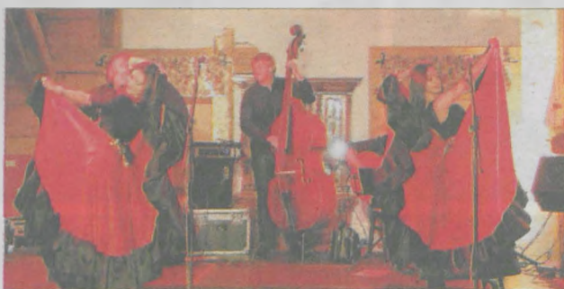
Podczas ubiegłorocznego festiwalu akordeonowego

- ostatnie spotkania i ćwiczenia w ramach projektu „Aktywny znaczy zdrowszy” wraz podsumowaniem.