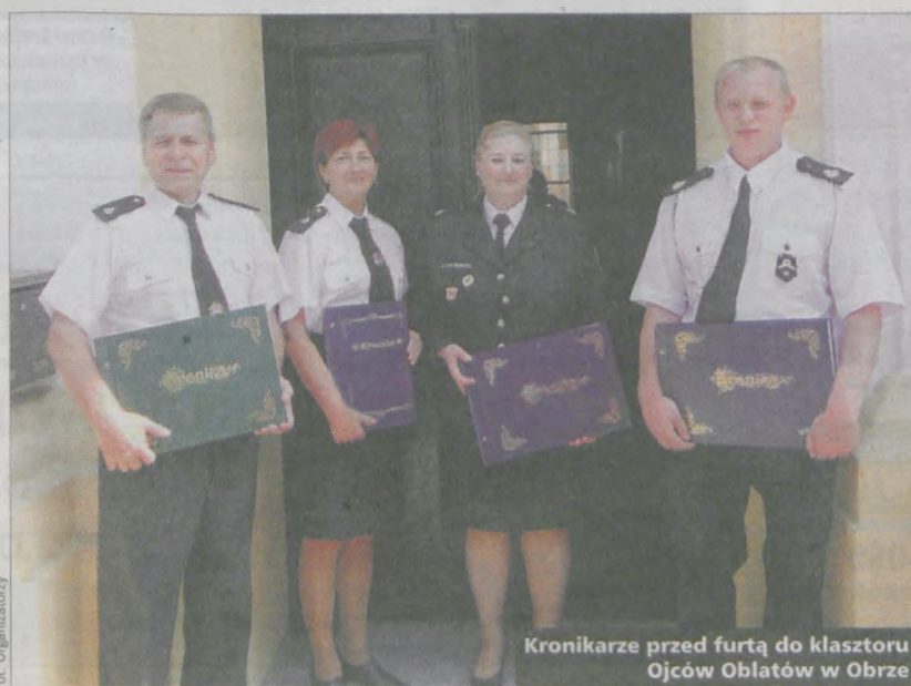
Kronikarze przed furtką do klasztoru Ojców Oblatów w Obrze