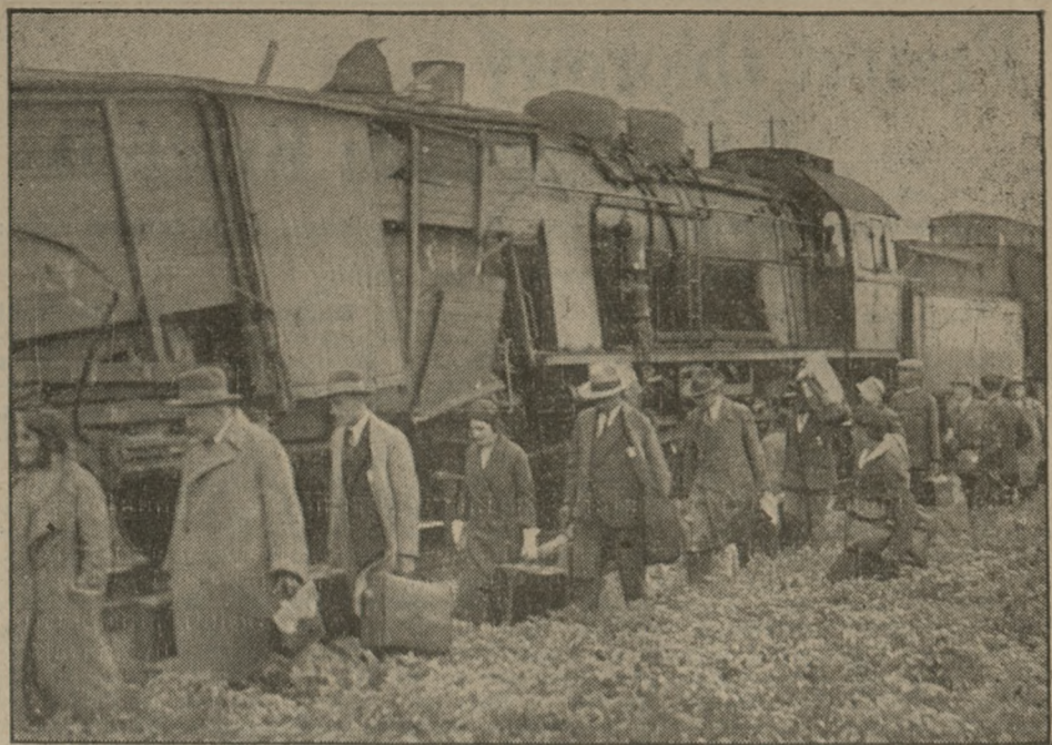
Zdjęcie powyższe przedstawia fragment katastrofy kolejowej — na szczęście niezbyt groźnej w skutkach — pod Kostrzynem, o której pisaliśmy w rannym wydaniu. Widzimy parowóz pociągu pospiesznego zeciepiony z ostatnim wagonem towarowym, a obok przymusową wędrowkę pasażerów do czekającego na stacji dodatkowego pociągu, aby dotrzeć do Poznania.

Studia teoretyczne w tym kierunku rozpoczęłam w roku 1912, wzorując się na wskazówkach Brown Séquarda i innych. Doświadczenia na ludziach zaczęłam przeprowadzać w dziesięć lat później. Pierwszych prób dokonałem na bezdomnych starcach w Bolonii. Muszę przyznać z ra-