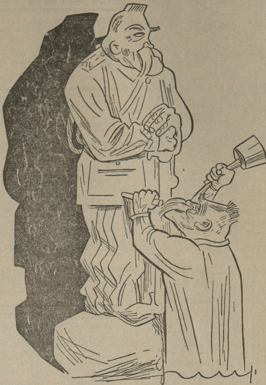
Mistrz: Jako centralna osoba przedstawia się nieźle, tylko wydaje mi się wciąż z małymi.

tuje w cisy ilość węzłów, smutnie kiwa głową: „Jeszcze trochę, jeszcze niewiele, a „piękna lady“ zostanie znów królową oceanu.“