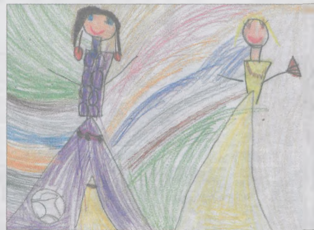
MAJA RATAJCZAK, lat 6, „Marcinek” w Jarocinie