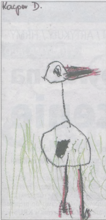
KACPER DOLATA lat 5, przedszkole w Kłęce