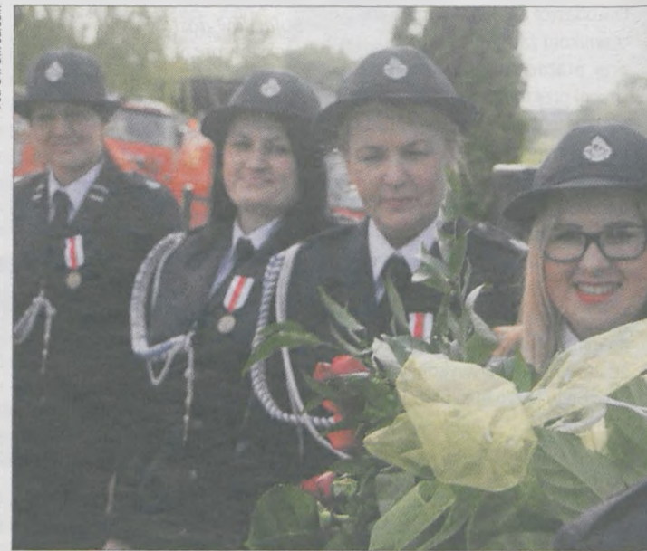
Odznaczone Brązowym Medalem za zasługi dla pożarnictwa członkinie jednostki OSP w Kadziaku