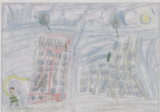
KRZYSZTOF WOELKE, lat 5, „Marcinek” w Jarocinie