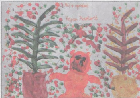
RAJAN KAPTUREK kl. II c, ZS w Kłęce