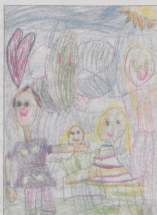
OLIWIA ROŻEK, lat 6, „Marcinek” w Jarocinie