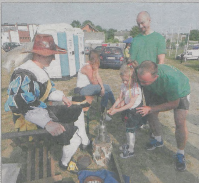
Jedną z atrakcji była możliwość wybijania monety na stanowisku mincerza