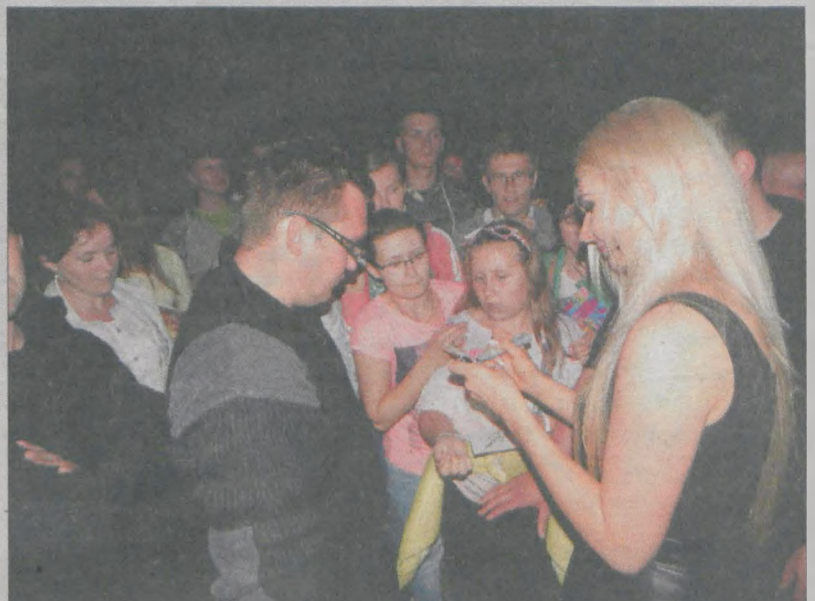
Wokalista zespołu Camasutra nie odmówił fanom autografów