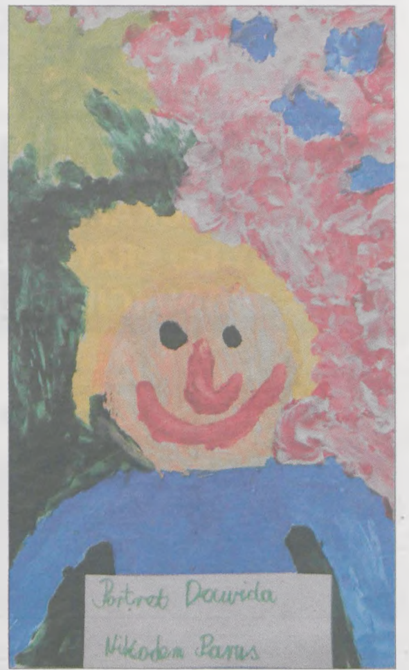
NIKODEM PARUS, kl. II c, ZS w Kłęce