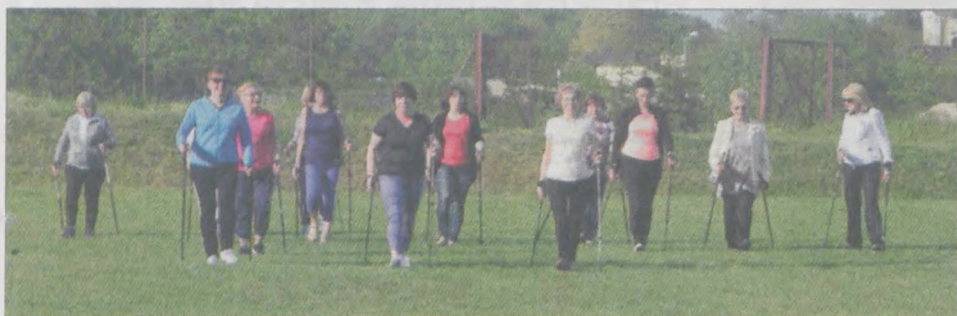
Panie z uśmiechem na twarzach uczyły się poprawnie chodzić z kijkami