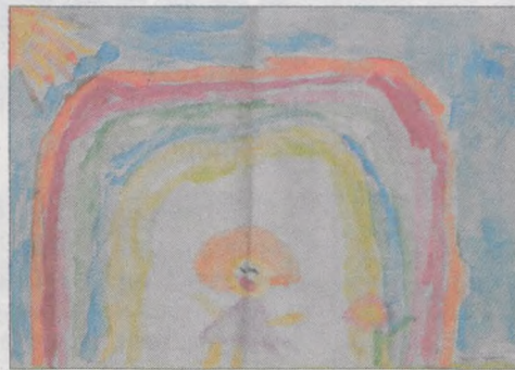
NATALIA KASPRZAK kl. I b, ZS w Kłęce