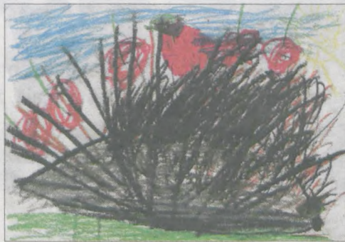
MATEUSZ WĘCLEWSKI lat 6, przedszkole w Kłęce