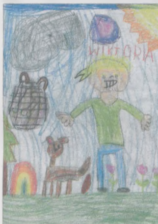
WIKTORIA WOELKE, lat 5, „Marcinek” w Jarocinie