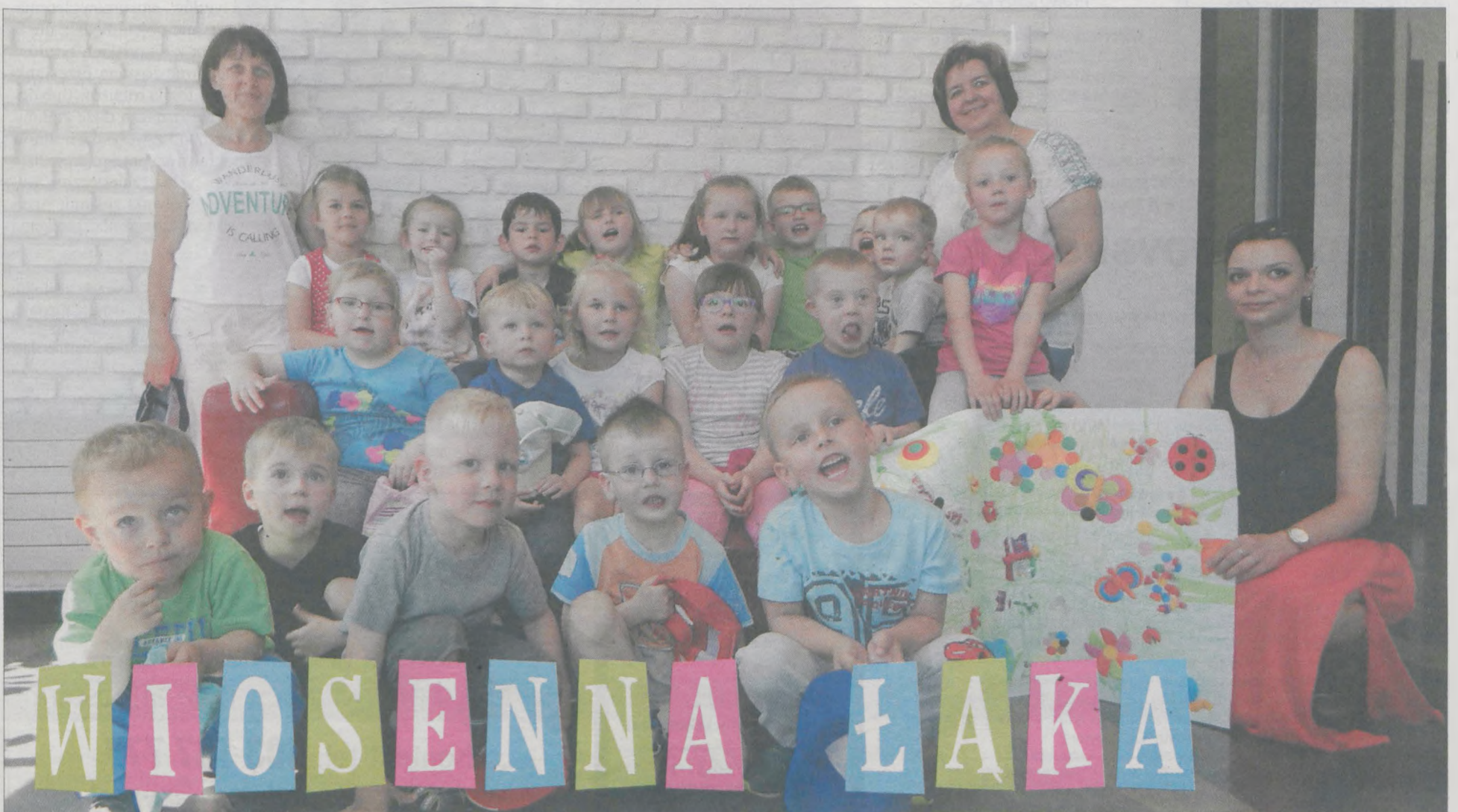
„MYSZKI” Z NIEPUBLICZNEGO PRZEDSZKOLA „MARCINEK” w Jarocinie przyniosły pracę zbiorową osobście