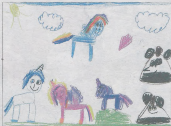
ZUZIA KOWALSKA, lat 6, „Marcinek” w Jarocinie