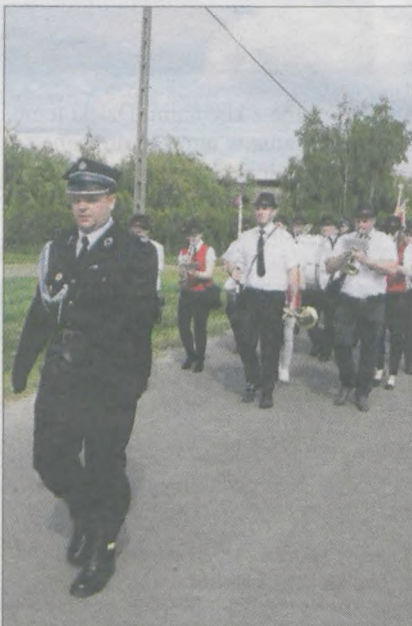
Przemarsz druhowa jubilatów