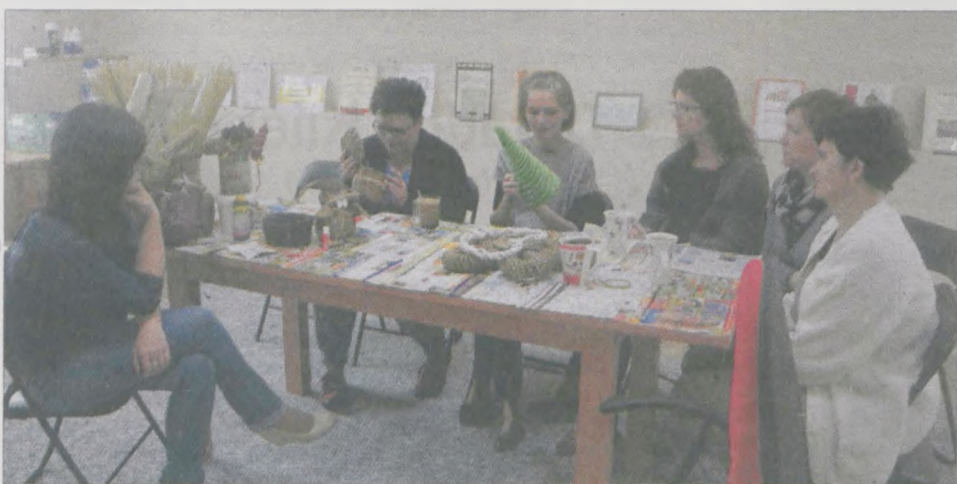
Wyplatanie papierowej wikliny okazało się bardzo wciągającym zajęciem

Od świętowania Dnia Bibliotekarzy rozpoczęły Tydzień Bibliotek pracownice jarocinskiej księżnicy. Kwiaty wręczyli paniom przedstawiciele władz gminy, a w uroczystości wzięli udział również najaktywniejsi czytelnicy.