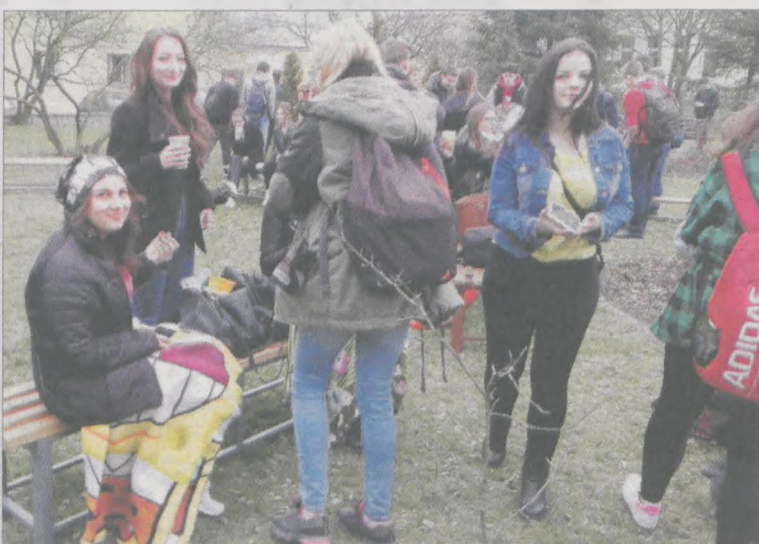
Niektórzy doszli do wniosku, że bez koca się nie obejdzie