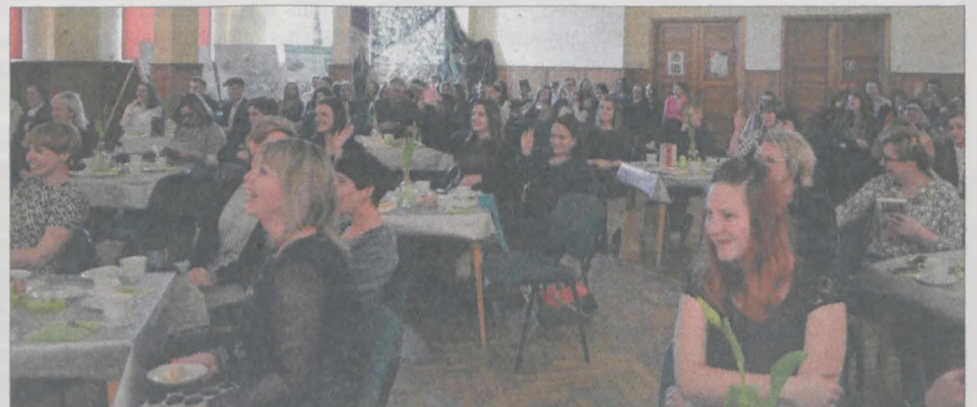
Pisarz tryskał humorem rozbawiając słuchaczy

Stowarzyszenie „Sympatyków Jedyńki” w ramach konkursu grantowego ogłoszonego przez gminę Jarocin uzyskało dotację w wysokości 2.800 zł. Pieniądze zostały przeznaczone na wsparcie organizacji Gali Młodych Twórców Literatury, w ramach której odbyły się m.in. warsztaty dziennikarskie oraz spotkania autorskie.