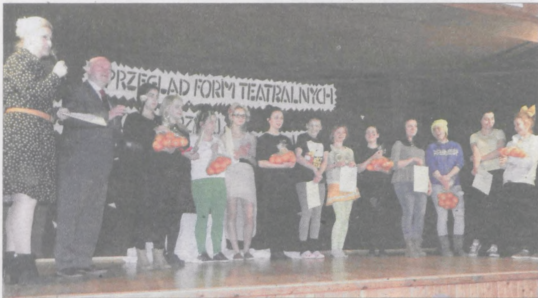
Dziewczęta dostały po występach drobne upominki