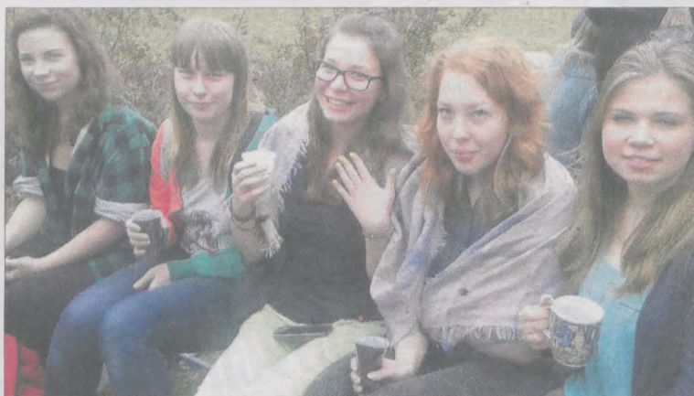
Gorącymi napojami rozgrzewały się uczennice ZSP nr 1