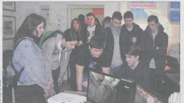
Młodzież z zainteresowaniem obejrzała wyposażenie szkoły i chętnie uczestniczyła w przygotowanych zajęciach i atrakcjach