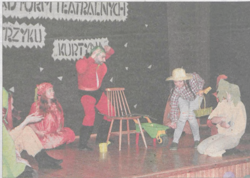
Nagrodę publiczności za przedstawienie „Pomidor” otrzymała grupa VI