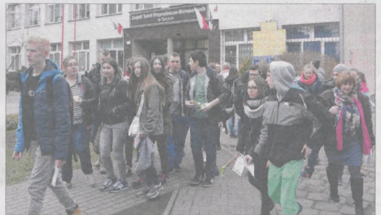
Gimnazjaliści z czterech powiatów skorzystali z zaproszenia szkoły w Tarcach i wzięli udział w dwudniowych „drzwiach otwartych”