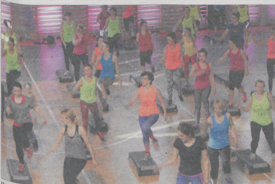
Uczestniczki ćwiczyły z dużym zaangażowaniem