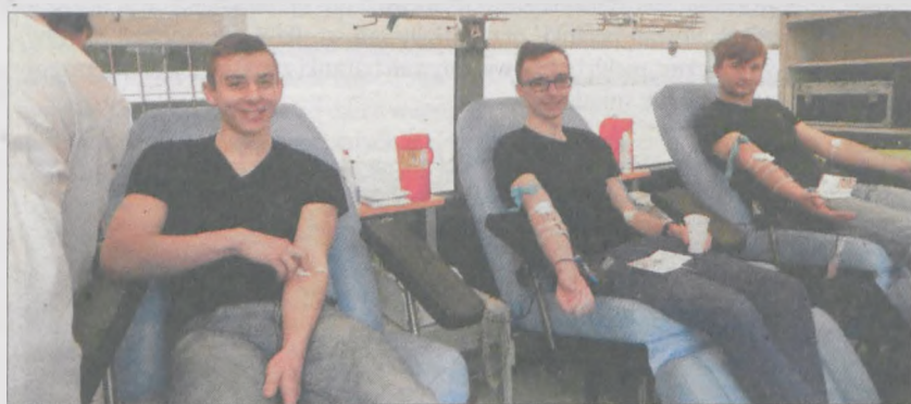
Igły nie odstraszyły uczniów, którzy postanowili oddać krew