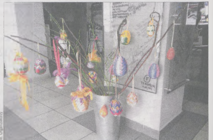
Tak prezentowały się jajka wielkanocne uczniów jarocińskiej „czwórki”