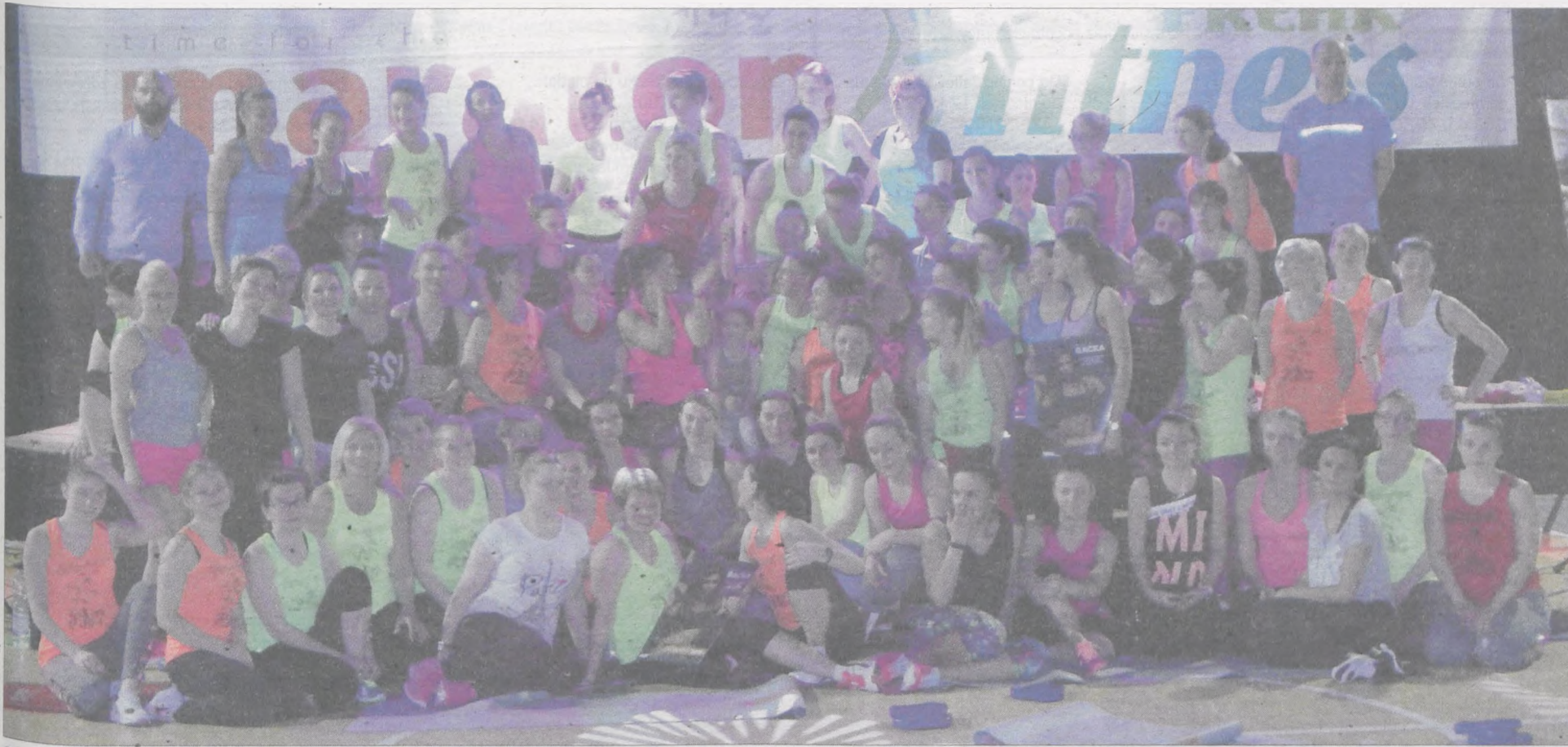
Organizatorzy i uczestnicy maratonu zrobili sobie na koniec wspólne zdjęcie

► BYŁA MISTRZYNI ŚWIATA PROWADZIŁA TRENING W JAROCINIE