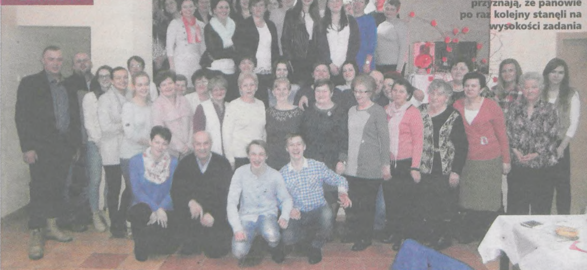
Uczestniczki spotkania z okazji Dnia Kobiet przyznają, że panowie po raz kolejny stanęli na wysokości zadania