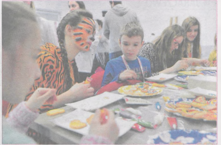
Z dużym zaangażowaniem uczestnicy akcji ozdabiali ciastka