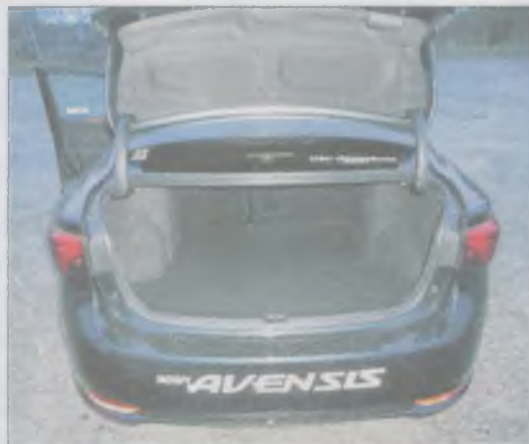
Bagażnik sedana ma 509 litrów pojemności