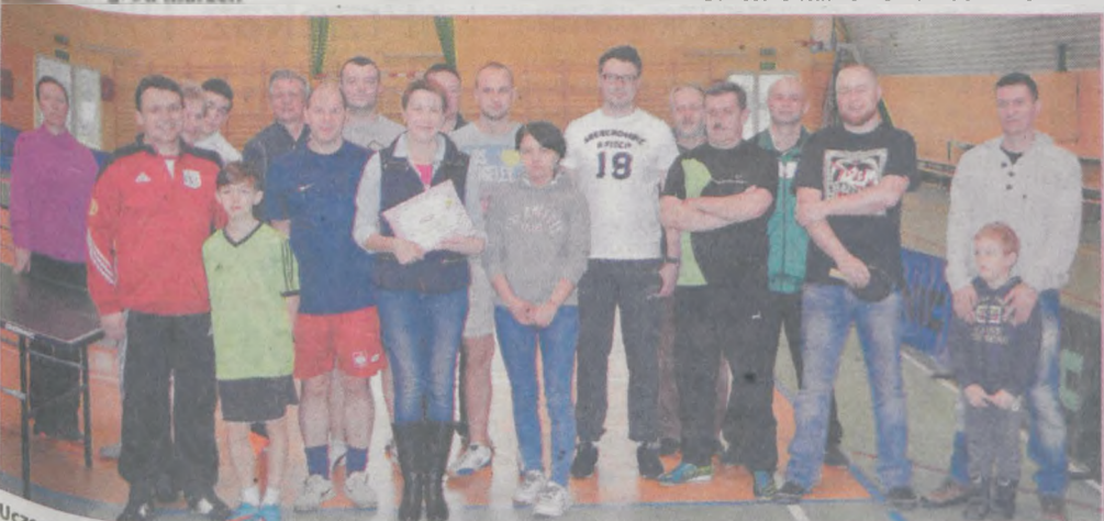
Uczestnicy turnieju tenisa stołowego stanęli do wspólnego zdjęcia przed rozpoczęciem rywalizacji