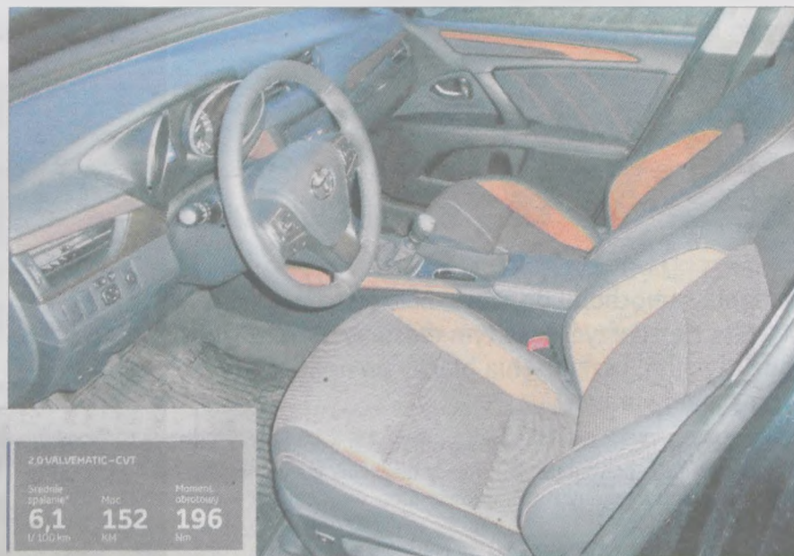
Fotele są wygodne, odpowiednio wyprofilowane