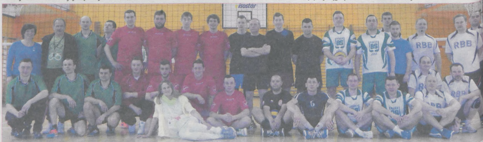
Pięć drużyn wzięło udział w turnieju siatkówki, a bezkonkurencyjna okazała się drużyna Kowalstwo Jaraczewo