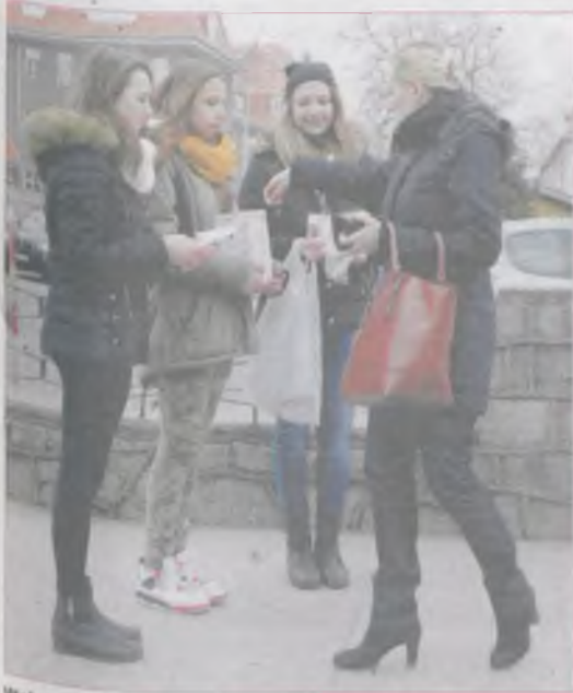
Wolontariusze od rana kwestowali na terenie całego miasta