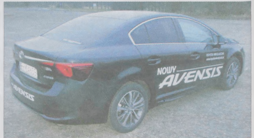
Linia boczna i dachu wyglądają jak u poprzednika, ale długość auta wzrosła o 40 mm