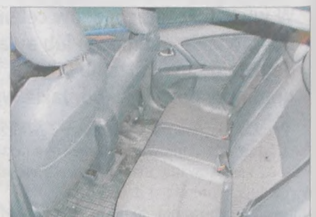
Podłoga jest płaska, bez środkowego tunelu