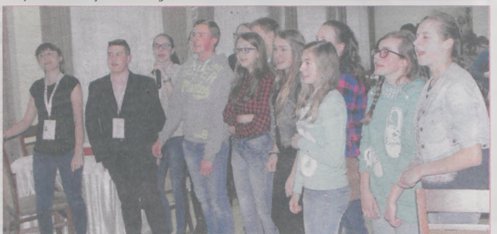
Grupa śmiałków wzięła udział w karaoke zorganizowanym w Żerkowie przez Fundację „Zerknij Tu”