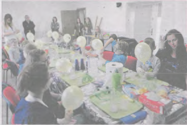
W czasie pokazów chemicznych brakowało wolnych miejsc