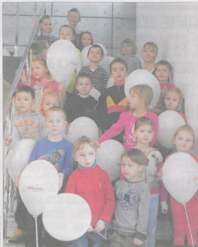
Przedшкоlaki zapozowały do wspólnego zdjęcia