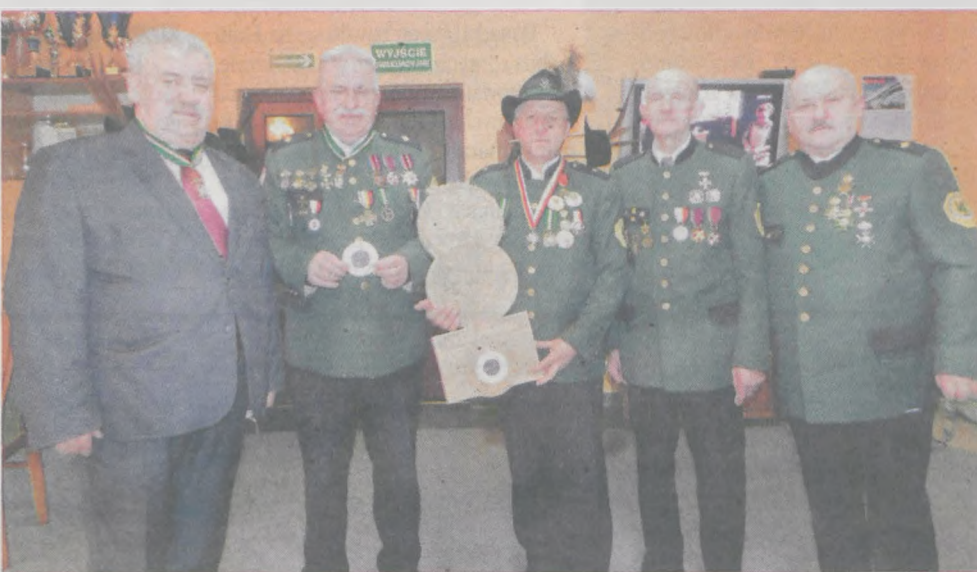
Bractwo Kurkowe z Jarocina zebrało 650 zł podczas turnieju strzeleckiego