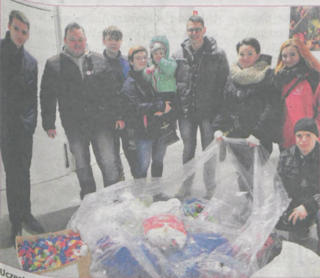
Uczestnicy zlotu przywieźli ze sobą kilogramy nakrętek dla Fundacji „Ogród Marzeń”