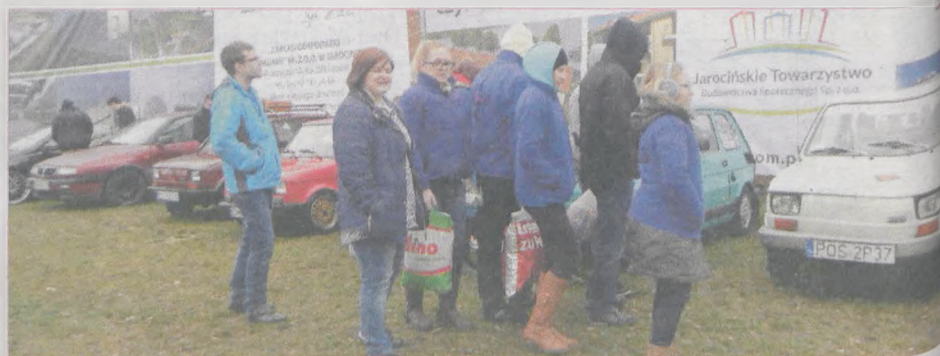
Zlot Alf Romeo, Lancii i Fiatów 126p przyciągnął wielu zainteresowanych