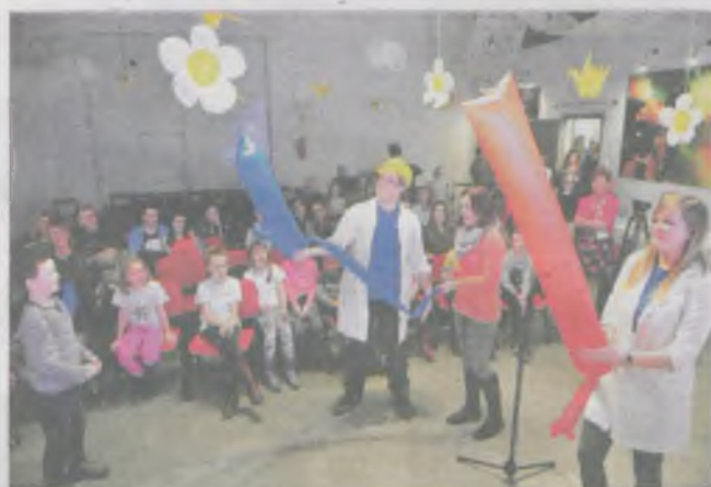
Pokazy naukowe cieszyły się dużym zainteresowaniem