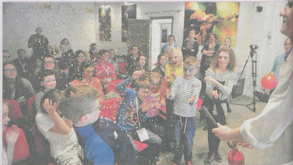
Gaśnica z konfetti? Takie rzeczy tylko na Warsztatach młodego naukowca