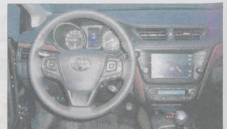
Deska rozdzielcza zyskała nowe zegary i 8-calowy wyświetlacz