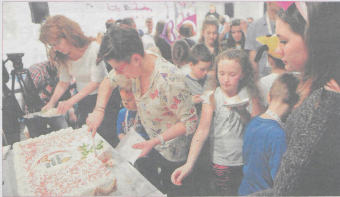
Nie mogło zabraknąć wielkiego tortu na zakończenie akcji